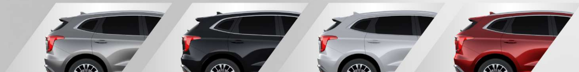
Ayers Gray : สีเทา