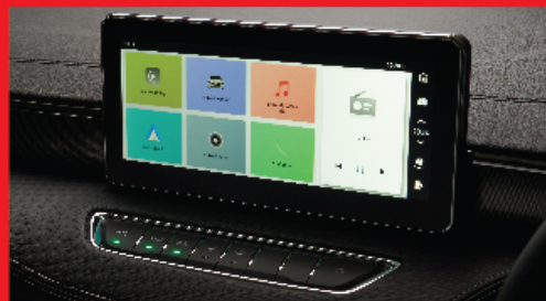
TOUCH SCREEN MULTIMEDIA DISPLAY หน้าจอสัมผัสขนาด 10.25" รองรับการเชื่อมต่อ APPLE CARPLAY® และ ANDROID AUTO™