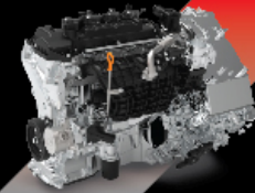
1.5L HYBRID ENGINE เครื่องยนต์ 1.5 ลิตร ทำงานร่วมกับมอเตอร์ไฟฟ้า ให้กำลังสูงสุด 190 แรงม้า และแรงบิดสูงสุด 375 นิวตัน-เมตร

SMOOTH เร่งแรง ไม่สะดุด EFFICIENCY พลังเต็มประสิทธิภาพ ตอบสนองในทุกการขับขี่