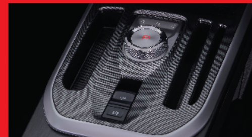
ELECTRONIC SHIFTER ชุดเกียร์ดีไซน์ล้ำ พร้อมลิฟต์แขน HIGH-GLOSS สบเบรคมือไฟฟ้า พร้อมระบบ AUTO BREAK HOLD