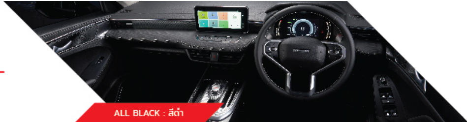
ALL BLACK : สีดำ