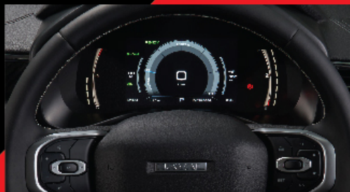
DIGITAL INFORMATION DISPLAY หน้าจอแสดงผลข้อมูลการขับขี่แบบดิจิทัลขนาด 7"