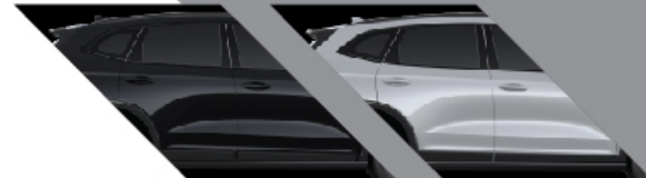
SUN BLACK : สีดำ