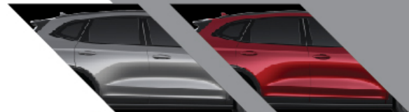
AYERS GRAY : สีเทา