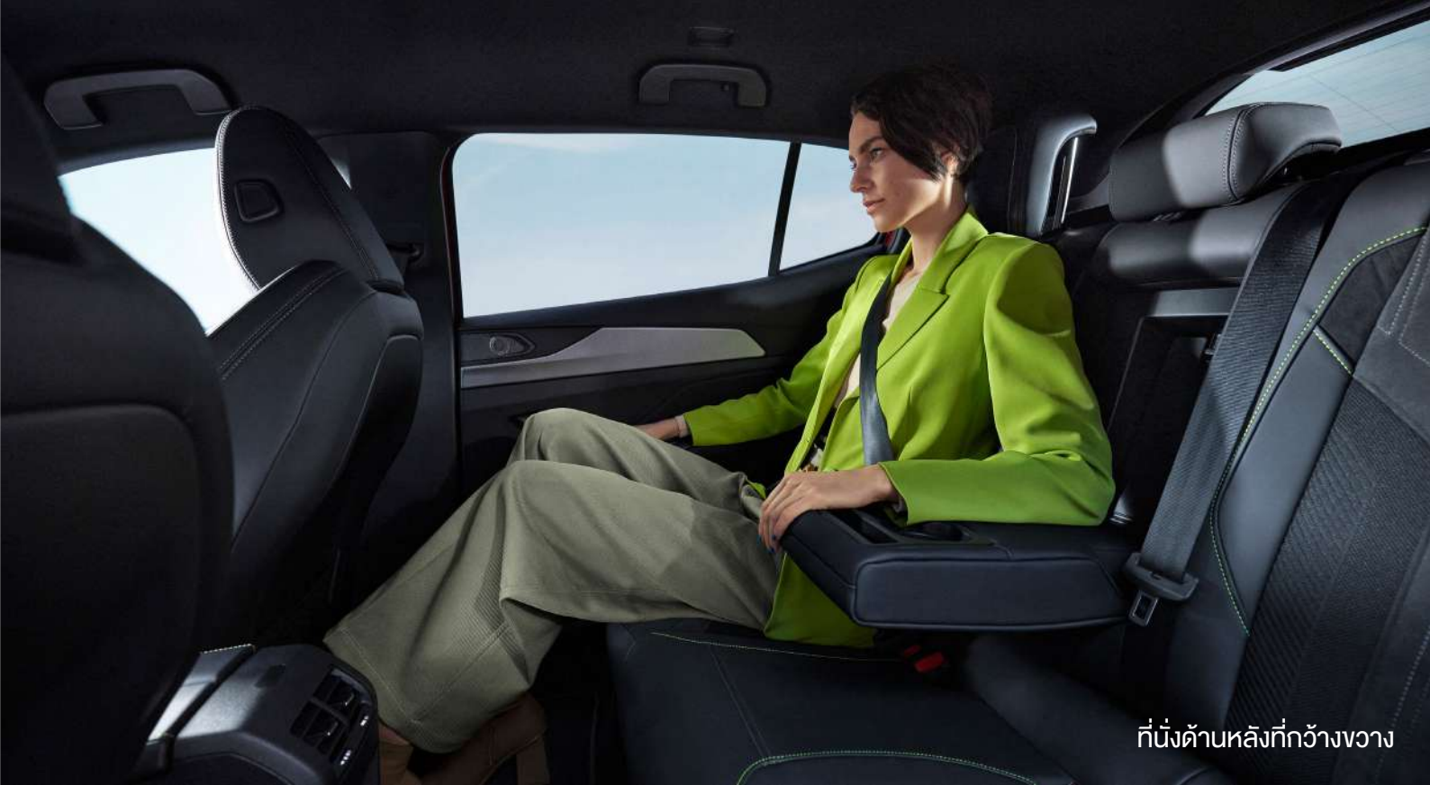
ที่นั่งด้านหลังที่กว้างขวาง