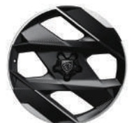
20" 'Monolithe' for GT