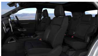
เบาะสีดำ (Ebony)