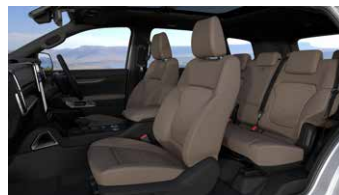
เบาะสีคิรินพราลีน (Praline)