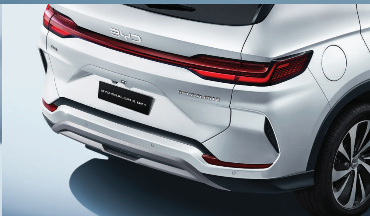
ดีไซน์ไฟเลี้ยวทรงหยดน้ำ พร้อมระบบไฟเลี้ยวด้านหลังแบบ Sequential