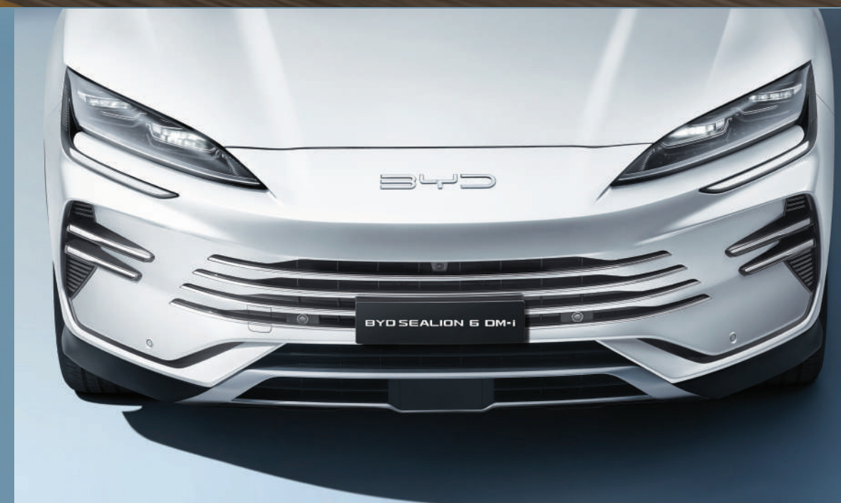
กระจหน้า ดีไซน์โฉบเฉี่ยว ภายใต้แนวคิด BYD OCEAN SERIES

สปอร์ตพรีเมียมโดดเด่นไม่ซ้ำใคร ด้วยดีไซน์ที่เป็นเอกลักษณ์ จากแนวคิด BYD OCEAN SERIES แรงบันดาลใจจากมหาสมุทร เรียบหรู โฉบเฉี่ยว ทรงพลัง สะท้อนเสน่ห์เหนือระดับที่เป็นคุณ