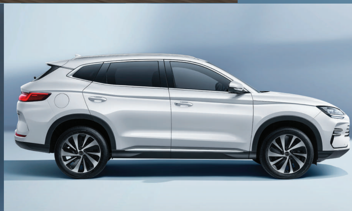
แถบอลูมิเนียมด้านข้าง เพิ่มความพรีเมียม และมิติให้ตัวรถ