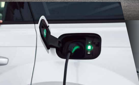
ระยะทางขับเคลื่อนด้วยไฟฟ้า 40.7 กิโลเมตรต่อการชาร์จไฟหนึ่งครั้ง (อ้างอิงตามผลการทดสอบโดยใช้มาตรฐาน WLTP)