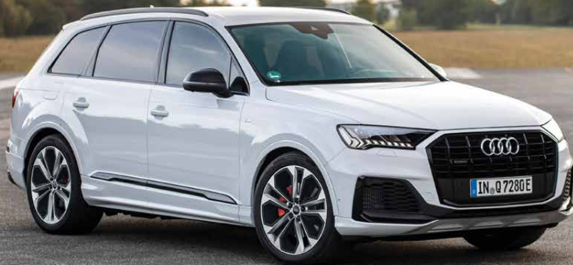
ชุดตกแต่งภายนอกแบบ S line และ Black Edition