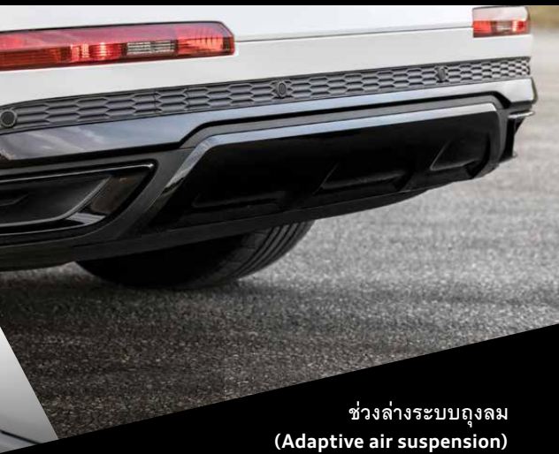
ช่วงล่างระบบถุงลม (Adaptive air suspension)