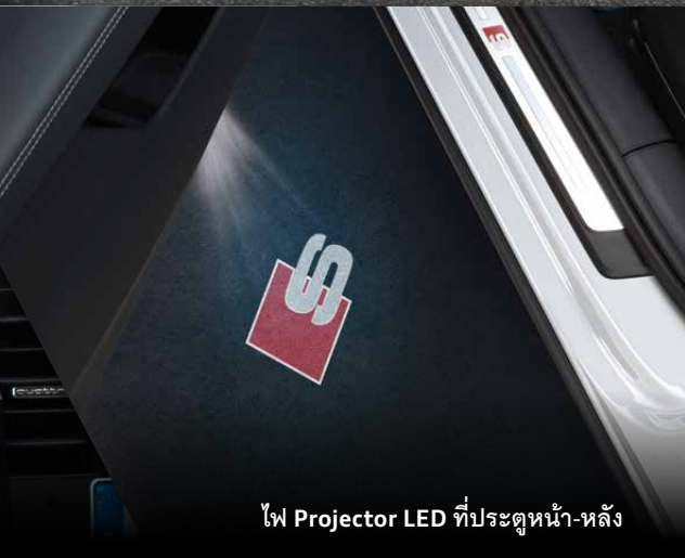
ไฟ Projector LED ที่ประตูหน้า-หลัง