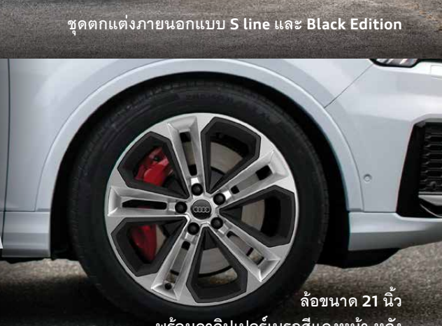
ล้อขนาด 21 นิ้ว พร้อมคาลิปเปอร์เบรกสีแดงหน้า-หลัง