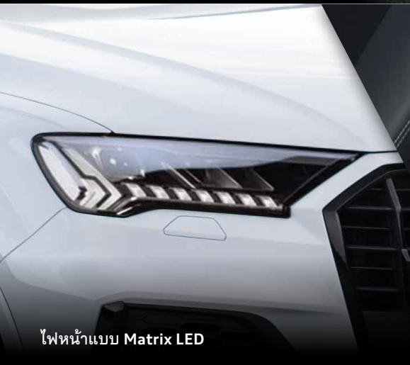
ไฟหน้าแบบ Matrix LED