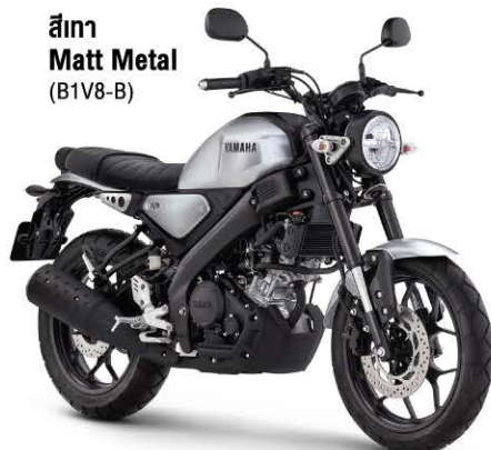
สีเทา Matt Metal (B1V8-B)

*รับประกันคุณภาพชิ้นส่วนใน 3 กลุ่มหลัก ได้แก่ กลุ่มเครื่องยนต์ กลุ่มโครงสร้าง และกลุ่มระบบไฟฟ้า โดย บริษัท ไทยยามาฮ่ามอเตอร์ จำกัด สอนตามรายละเอียดเพิ่มเติมได้ที่ ศูนย์จำหน่ายและบริการยามาฮ่าทั่วประเทศ หรือศึกษารายละเอียดเพิ่มเติมที่ www.yamaha-motor.co.th **ภาพถ่ายเพื่อใช้ประกอบการโฆษณาเท่านั้น