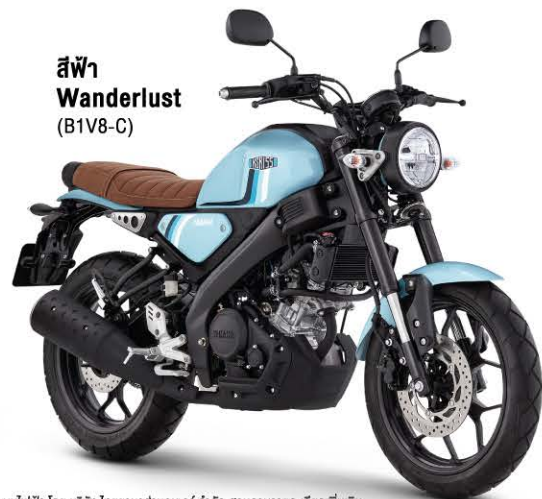
สีฟ้า Wanderlust (B1V8-C)