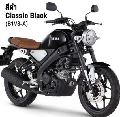
สีดำ Classic Black (B1V8-A)