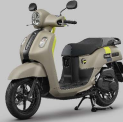
น้ำตาล-เหลือง Sugar Brown