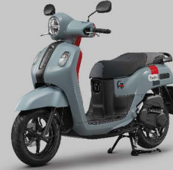
เทา-แดง Lava Gray