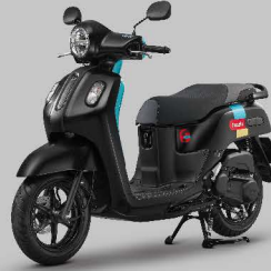
ดำ-ฟ้า Iced Black