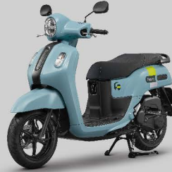
ฟ้า Candy Blue