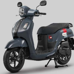
เทา Gummy Gray