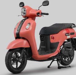
ชมพู Milky Pink