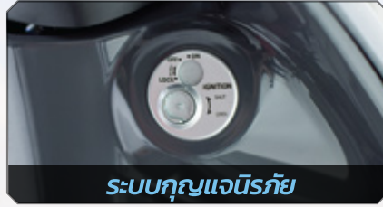
ระบบกักแฉก

เพิ่มความสะดวกสบายด้วยเรือนไมล์ขนาดใหญ่ อ่านง่าย และแสดงผลครบครัน