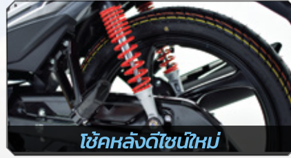
โช๊คหลังดีไซน์ใหม่

ปลอดภัยยิ่งขึ้น กับระบบกักแฉก แบบล็อก 2 ชั้น (เฉพาะรุ่น LE/LB/LA)