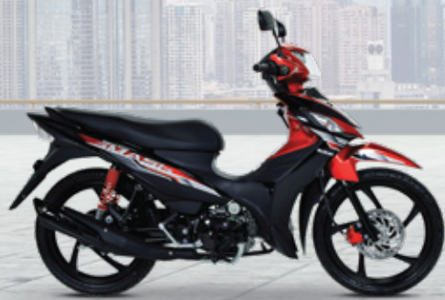
Onyx / Alpha Red ดำ / แดง

*ทดสอบภายใต้มาตรฐานไอเสียระดับ 7 โดยสถาบันยานยนต์