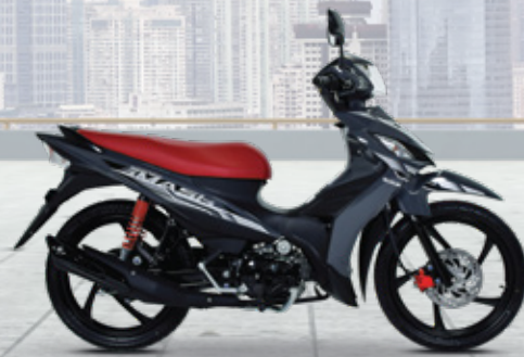
Ultimate Gray เทา