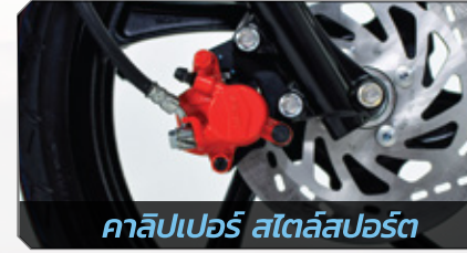
คาลิปเปอร์ สไตล์สปอร์ต

โช๊คหลังแบบคู่ สีแดงใหม่ ให้สมรรถนะที่ดียเยี่ยม สไตล์ Ultimate Edition