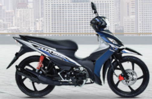
Stellar Blue / Silver น้ำเงิน / เทา / ดำ

หมายเหตุ :- สีเทา มีเฉพาะในรุ่น LE เท่านั้น