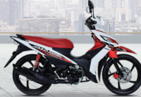
White / Burgundy ขาว / แดง