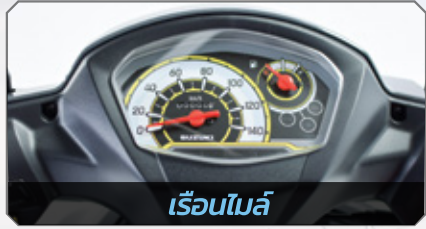
เรือนไมล์

New Suzuki Smash "Ultimate Edition" ดีไซน์ใหม่ล่าสุด สวย เก๋ พาคุณไปได้ทุกที่...ที่ใจต้องการ พร้อมเทคโนโลยีเครื่องยนต์ LEaP Technology ประสิทธิภาพสูง ประหยัดน้ำมัน ทนทาน ลิขสิทธิ์เฉพาะจาก ซูซูกิ สมุกในทุกการเดินทางไปกับ... New Suzuki Smash Fi "เติมชีวิตให้สุดสเมซ"