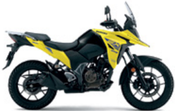
Champion Yellow No.2 (YU1)