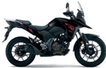
Glass Sparkle Black (YVB)