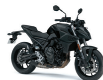
Metallic Mat Black No.2 / Glass Sparkle Black (KGL)