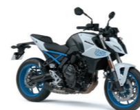
Pearl Tech White (QU2)