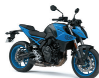
Pearl Cosmic Blue (QU1)