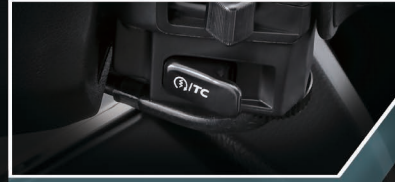
New Suzuki Easy Start System

เบรคหน้า Twin Disc ใหญ่ถึง 260 มม. และเบรคหลัง Single Disc 210 มม. พร้อมกล่อง ABS ใหม่ ประสิทธิภาพสูงและเบากว่าเดิมถึง 36 กรัม