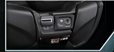
Rear Brake Lock System

โช๊คหน้าขนาดใหญ่ถึง 41 มม. และโช๊คหลังระบบ Link-Type Monoshock ให้ความมั่นใจขณะขับขี่และขับแรงกระแทกได้เป็นอย่างดี