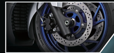
New Lightweight ABS

ครั้งแรกของ Suzuki Burgman 400 กับระบบ Traction Control ช่วยลดอาการสั่นโคลงทั้งขณะออกตัวและขับขึ้นเนินชัน / ชรุยระ