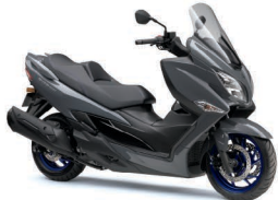
Solid Iron Gray (YUD)