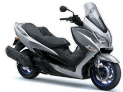
Metallic Mat Sword Silver (QKA)