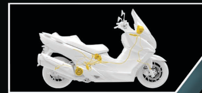
New Traction Control System

เครื่องยนต์ขนาด 399.9 ซีซี แบบ DOHC มาพร้อมเทคโนโลยี Dual Spark ให้ความเร็วสูงสุดที่มากขึ้นและประหยัดน้ำมันยิ่งขึ้น