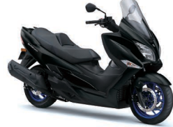
Metallic Mat Black No.2 (YKV)