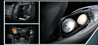
Large Storage with DC Outlet

เบาะที่นั่ง Dual Seat เติมน้ำมันด้วยแบบ Double Stitching สามารถปรับเบาะพนักได้ถึง 2 ระดับ เพื่อให้เหมาะกับสรีระในการขับขี่มากที่สุด