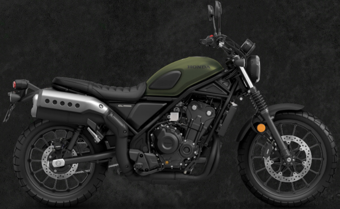
MAT LAUREL GREEN METALLIC (GNB)