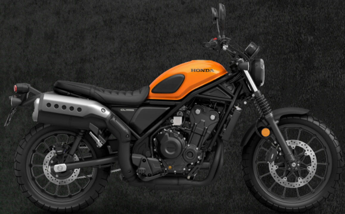
CANDY ENERGY ORANGE (O-B)