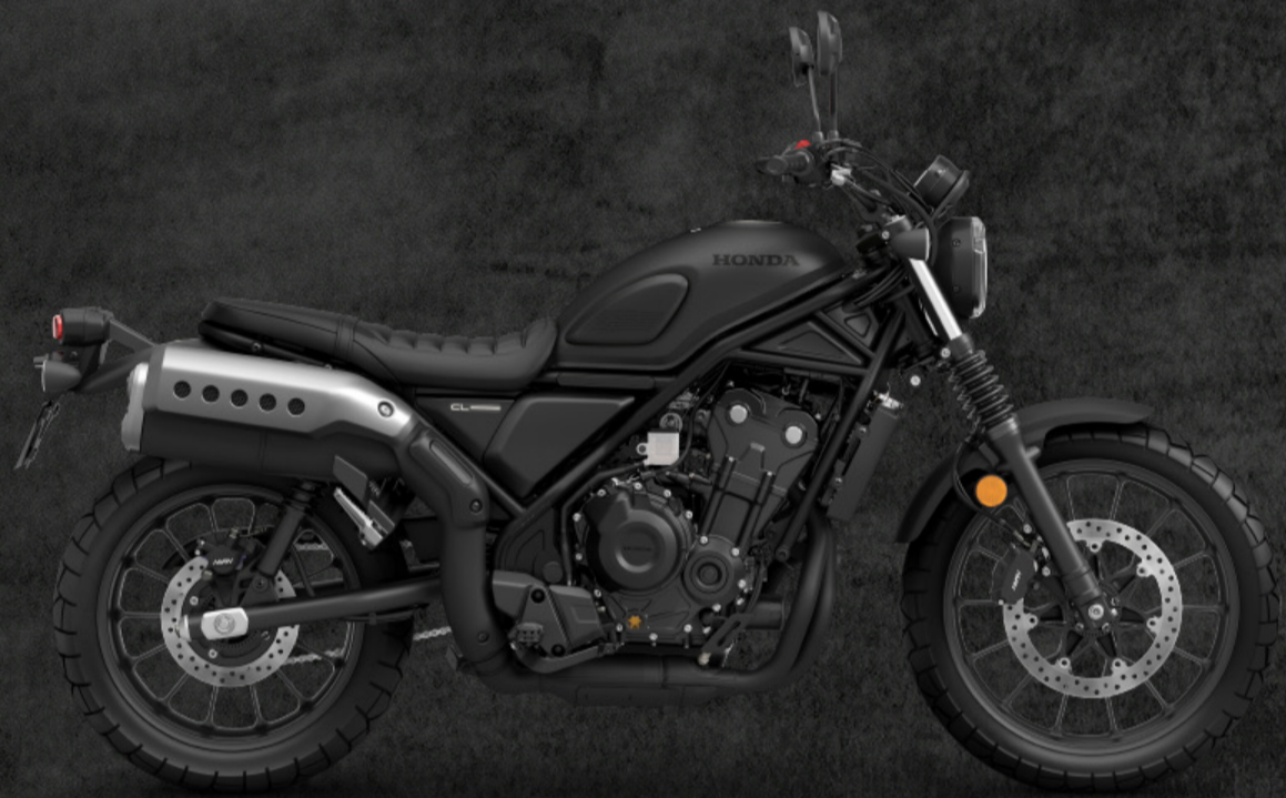
MAT GUNPOWDER BLACK METALLIC (BLK)