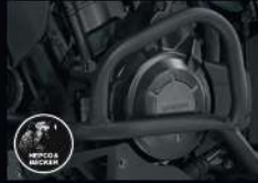
กันลั่นเครื่อง CB500X ENGINE GUARD CB500X APMGT11330TA 9,690.-