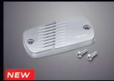
NEW ฝาครอบกระจุกน้ำมันเบรก สีเงิน M/C CAP SILVER THMKPHM45510TA