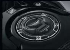
กันลั่นฝาถัง FUEL LID PAD APMKNAJ17600ZA 260.-