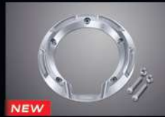
NEW วงแหวนฝาถังน้ำมัน KIT, FUEL LID RING THMKPHM17620TA 840.-