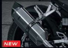
NEW ชุดท่อไอเสียเต็มระบบ 500 ซีรีส์ VAMOS EXHAUST FULL SYSTEM 500 THMKPHM1B300TA 11,930.-