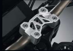
ตุ้กตาแฮนด์ HANDLE BAR CLAMP APMKNAJ53310TA 920.-