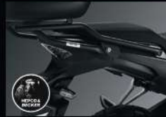
เหล็กท้ายเบา (ไม่มีแผ่น) REAR RACK (NONE PLATE) APMKPAJ81200TA 7,260.-