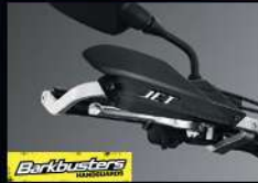
แฮนด์การ์ด HANDLE GUARD BARKBUSTERS JET APMKPAJ53100ZA 2,840.-