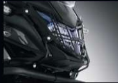
หน้ากากไฟหน้า HEADLIGHT MASK APMKPAJ64130TA 1,170.-