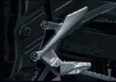
พิกัดเท้าแบบวิบาก MAIN STEP MX APMKPAJ64390TA 1,420.-