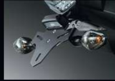
ชุดแต่งบังโคลนท้ายสั้น SHORT REAR FENDER APMJWB0101ZA 1,840.-