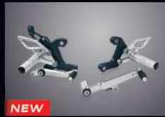
NEW ชุดเกียร์รอง 500 ซีรีส์ KIT, BACK STEP 500 THMKPHM50700TA 6,340.-