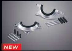
NEW ชุดครอบฝาเครื่องท้ายขวา 500 ซีรีส์ ENGINE COVER 500 THMKPHM11330TA 3,420.-