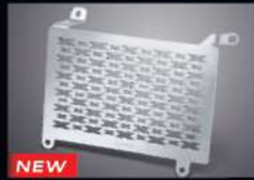
NEW ครอบหม้อน้ำ 500X RADIATOR COVER 500X THMKPHM19010TA 1,410.-