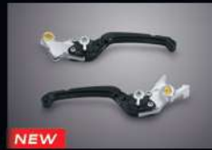
NEW ชุดมือเบรก มือคลัทช์ สีดำ KIT, BRAKE & CLUTCH LEVER BLACK THMKPHM53175TA 3,260.-