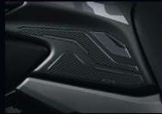
กันลั่นข้างถังน้ำมัน X SIDE TANK PAD X APMKPAJ17710ZA 420.-