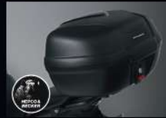
กระป๋องพลาสติก 48 ลิตร TOPBOX 48L H&B APSTDJHBA48ZA 5,840.-