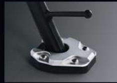
แผ่นรองข้างใต้ SIDE STAND PLATE APMKPAJ50530TA 680.-