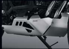
การ์ดท้องเครื่อง UNDER GUARD APMKPAJ64310TA 2,870.-