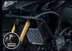
กันลั่นถังน้ำมัน TANK GUARD CB500X '18 APMKPAJ17500TA 9,920.-