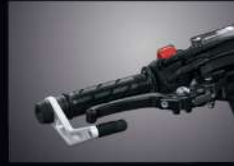
ชุดการ์ดมือเบรกและตุ้มปลายแฮนด์ BRAKE LEVER GUARD AND WEIGHT END CAP APMKNAJ131000TA 1,640.-