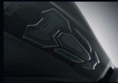
กันลั่นถังน้ำมัน กลาง CENTER TANK PAD APMKNAJ17800ZA 270.-