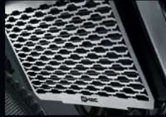
ครอบหม้อน้ำ RADIATOR COVER APMKJW19010TA 1,410.-