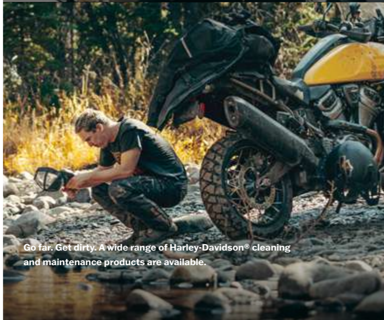
Go far. Get dirty. A wide range of Harley-Davidson® cleaning and maintenance products are available.