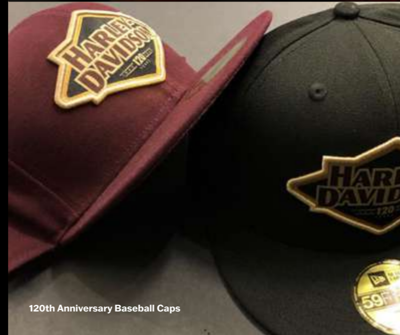
120th Anniversary Baseball Caps