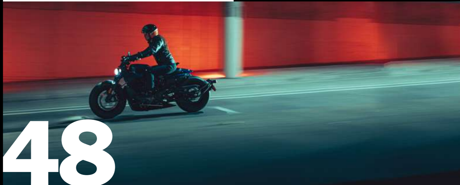
Adventure Touring lineup