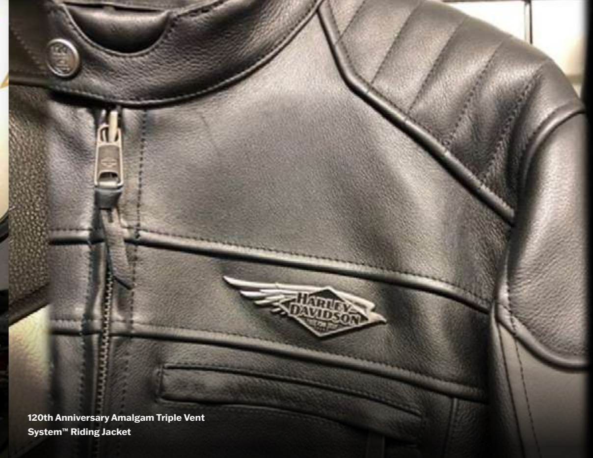
120th Anniversary Amalgam Triple Vent System™ Riding Jacket