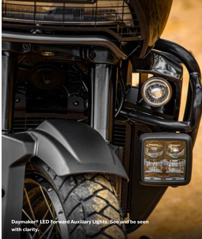
Daymaker® LED Forward Auxiliary Lights. See and be seen with clarity.