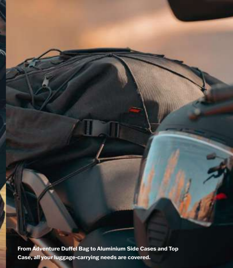
From Adventure Duffel Bag to Aluminium Side Cases and Top Case, all your luggage-carrying needs are covered.