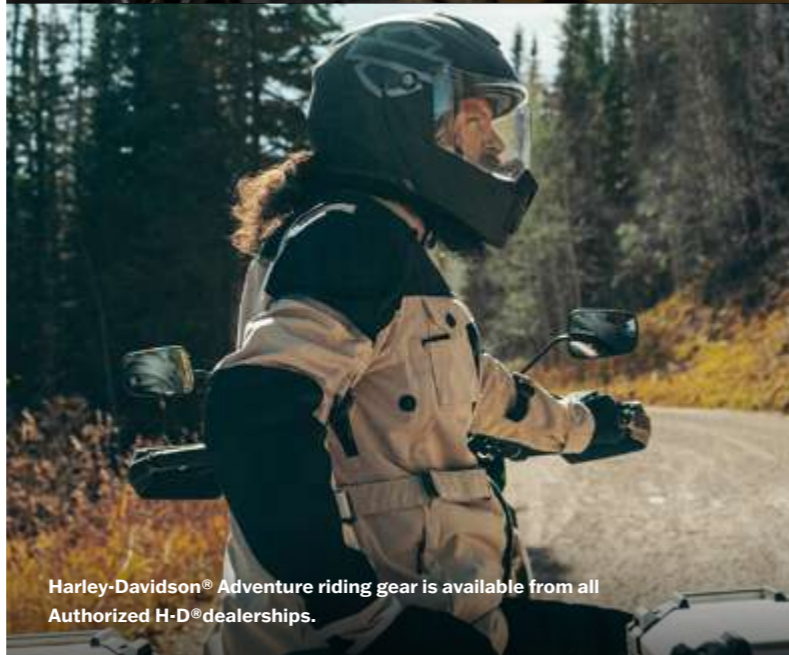
Harley-Davidson® Adventure riding gear is available from all Authorized H-D® dealerships.

การเป็นเจ้าของ Pan America™ สักคัน เป็นเพียงแค่การเริ่มต้นการผจญภัยครั้งต่อไปของคุณ อย่าลืมติดอาวุธให้ครบมือด้วยชิ้นส่วนและอุปกรณ์เสริมของแท้ รวมทั้งอุปกรณ์สำหรับการขับขี่จาก Harley-Davidson® ก่อนที่คุณจะเริ่มออกสำรวจโลกกว้าง ไม่ว่าจะกลางคืนหรือกลางวัน ไม่ว่าจะร้อนหรือหนาว ถนนที่ราบเรียบหรือเส้นทางออฟโรด คุณจะพบกับทุกสิ่งที่ต้องการได้ที่ศูนย์จำหน่าย H-D® ไม้พื้นที่ของคุณ