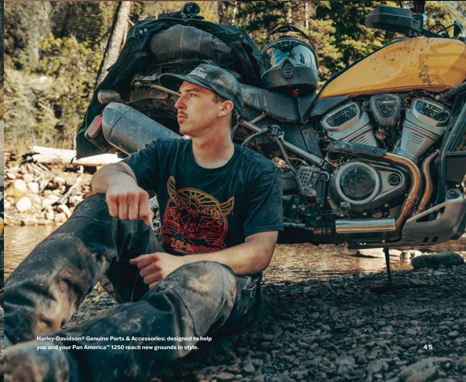
Harley-Davidson® Genuine Parts & Accessories: designed to help you and your Pan America™ 1250 reach new grounds in style.