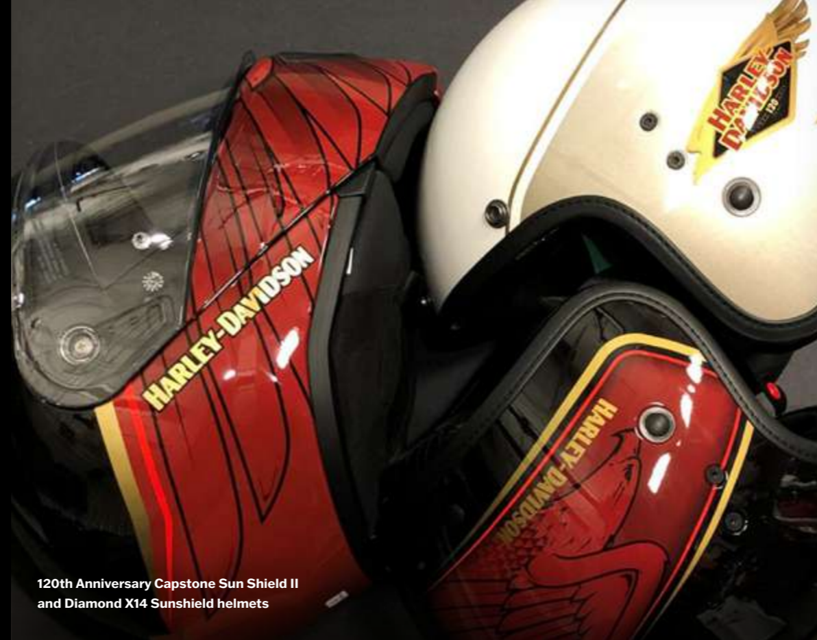
120th Anniversary Capstone Sun Shield II and Diamond X14 Sunshield helmets

2023 คือวาระครบรอบปีที่ 120 ของ Harley-Davidson® บทพิเศษในประวัติศาสตร์ของเราจะเป็นช่วงเวลาแห่งการเฉลิมฉลองและการสร้างความทรงจำดีๆ อุปกรณ์ขับขี่และเครื่องแต่งกาย 120th Anniversary สุดพิเศษของเราจาก Harley-Davidson MotorClothes® จะช่วยให้คุณความทรงจำเหล่านั้นคงอยู่ตลอดไป และเช่นเดียวกับมอเตอร์ไซค์ กลุ่มผลิตภัณฑ์เครื่องแต่งกาย 120th Anniversary ของเราก็ล้วนน่าประทับใจและมีให้สำหรับทุกคน นับตั้งแต่หมวกกันน็อก ถุงมือ เสื้อยืด แจ็กเก็ต สำหรับขับขี่ และอีกมากมาย โดยเฉพาะชิ้นที่คิดสรรมาอย่างดีนี้จะมาพร้อมโลโก้ 120th Anniversary ที่ไม่มีใครเหมือน ความทรงจำคือสิ่งที่คุณสร้างขึ้น สร้างความทรงจำของคุณได้แล้ววันนี้