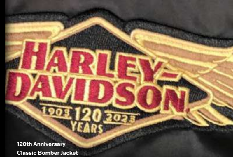
120th Anniversary Classic Bomber Jacket