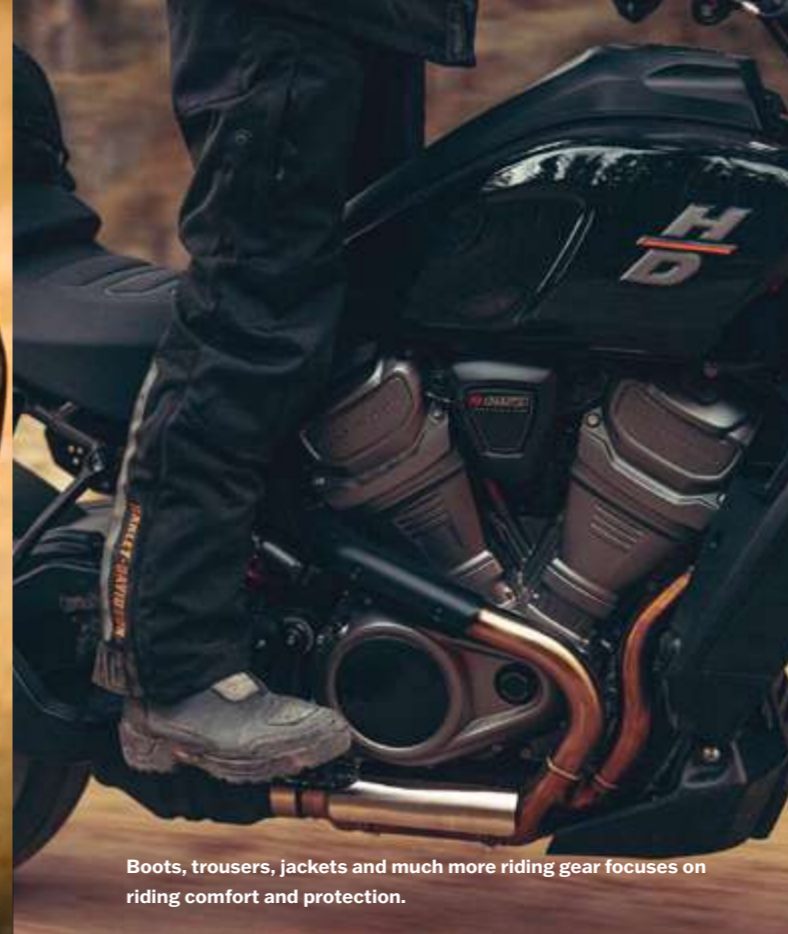
Boots, trousers, jackets and much more riding gear focuses on riding comfort and protection.