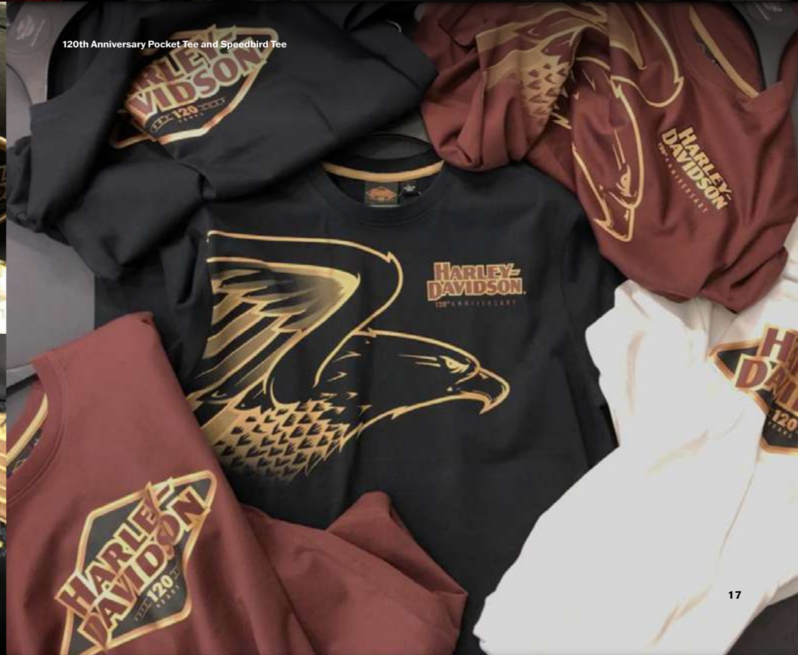
120th Anniversary Pocket Tee and Speedbird Tee