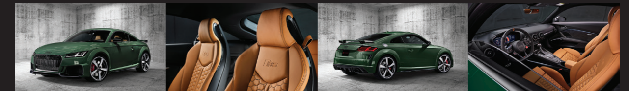
Malachite Green Metallic