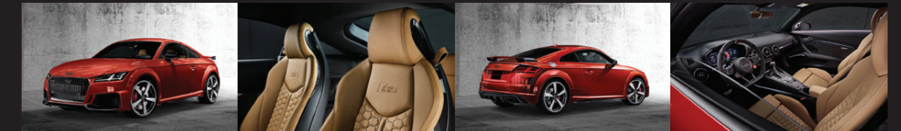
Tizian Red Metallic