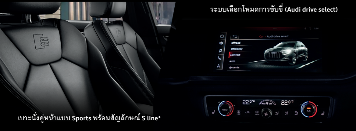
ระบบเลือกโหมดการขับขี่ (Audi drive select)