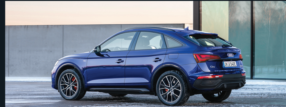
ชุดตกแต่งภายนอกแบบ S line และ Black Edition