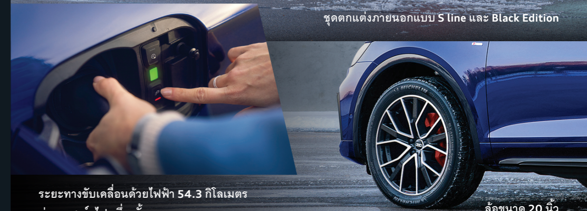
ระยะทางขับเคลื่อนด้วยไฟฟ้า 54.3 กิโลเมตร ต่อการชาร์จไฟหนึ่งครั้ง (อ้างอิงตามผลการทดสอบโดยใช้มาตรฐาน WLTP)