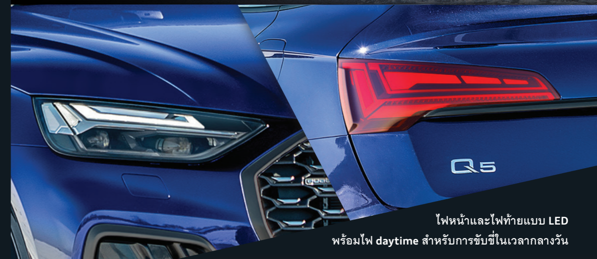
ไฟหน้าและไฟท้ายแบบ LED พร้อมไฟ daytime สำหรับการขับขี่ในเวลากลางวัน