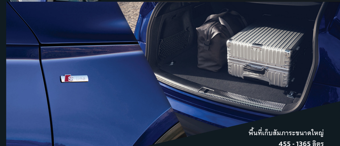
พื้นที่เก็บสัมภาระขนาดใหญ่ 455 - 1365 ลิตร