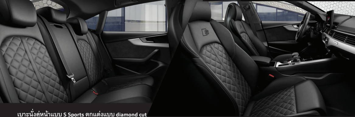
เบาะนั่งคู่หน้าแบบ S Sports ตกแต่งแบบ diamond cut พร้อมสัญลักษณ์ S line และฟังก์ชันนวดเพื่อการผ่อนคลาย