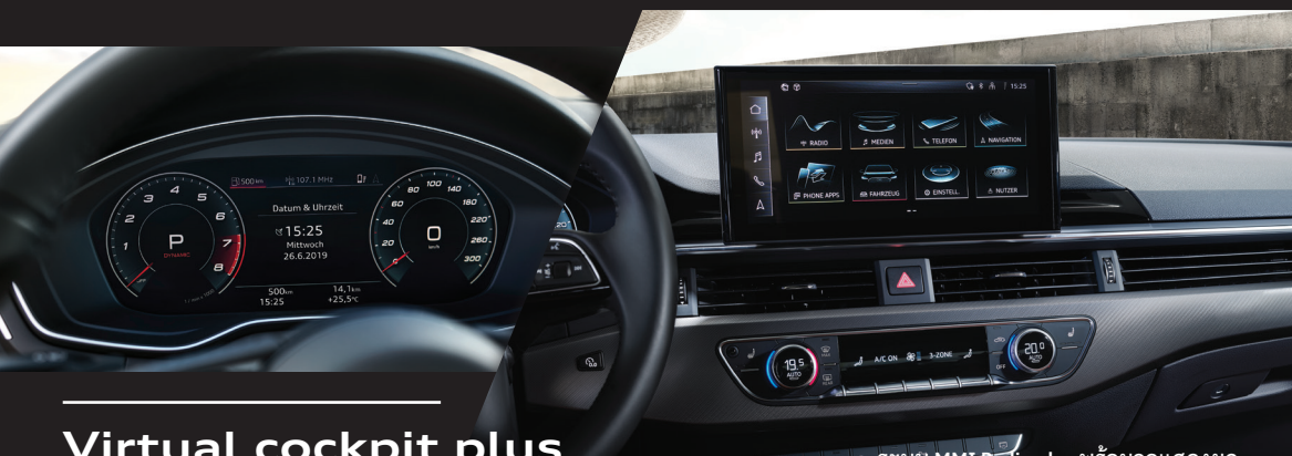
Virtual cockpit plus