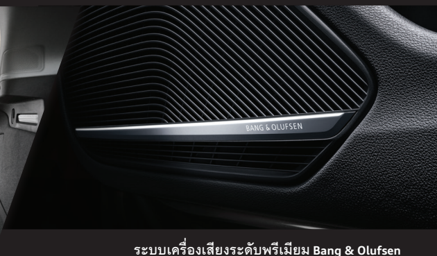
ระบบเครื่องเสียงระดับพรีเมียม Bang & Olufsen พร้อมระบบเสียง 3 มิติ