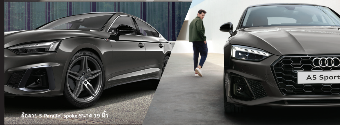
ล้อลาย 5-Parallel-spoke ขนาด 19 นิ้ว