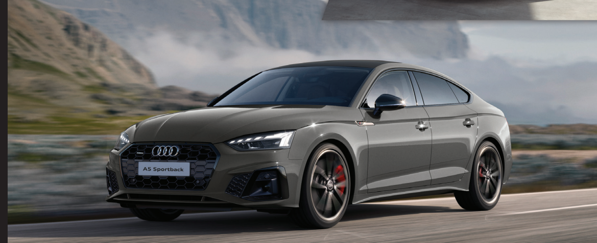
ช่วงล่างแบบ Sports และคาลิเปอร์เบรกสีแดงหน้า-หลัง