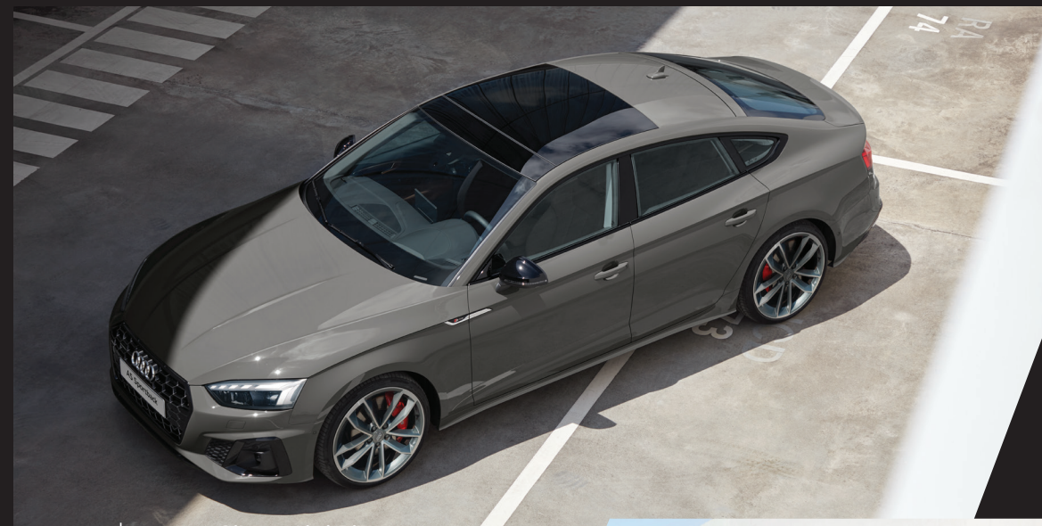
ชุดตกแต่งภายนอกแบบ S line และ Black Edition