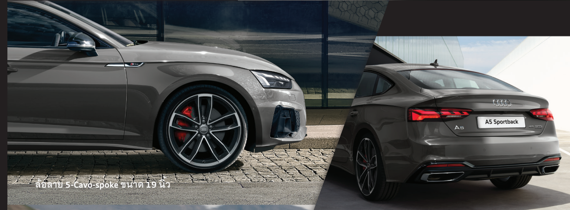
ล้อลาย 5-Cavo-spoke ขนาด 19 นิ้ว