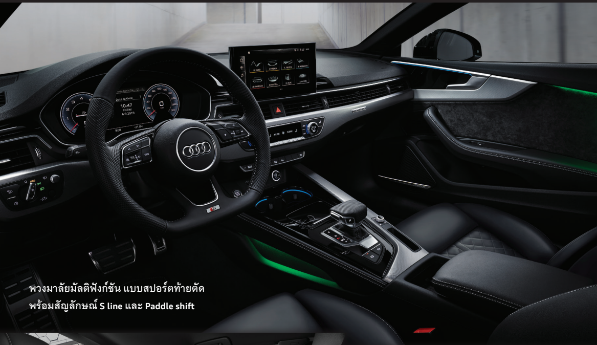
พวงมาลัยมัลติฟังก์ชัน แบบสปอร์ตทำยัด พร้อมสัญลักษณ์ S line และ Paddle shift