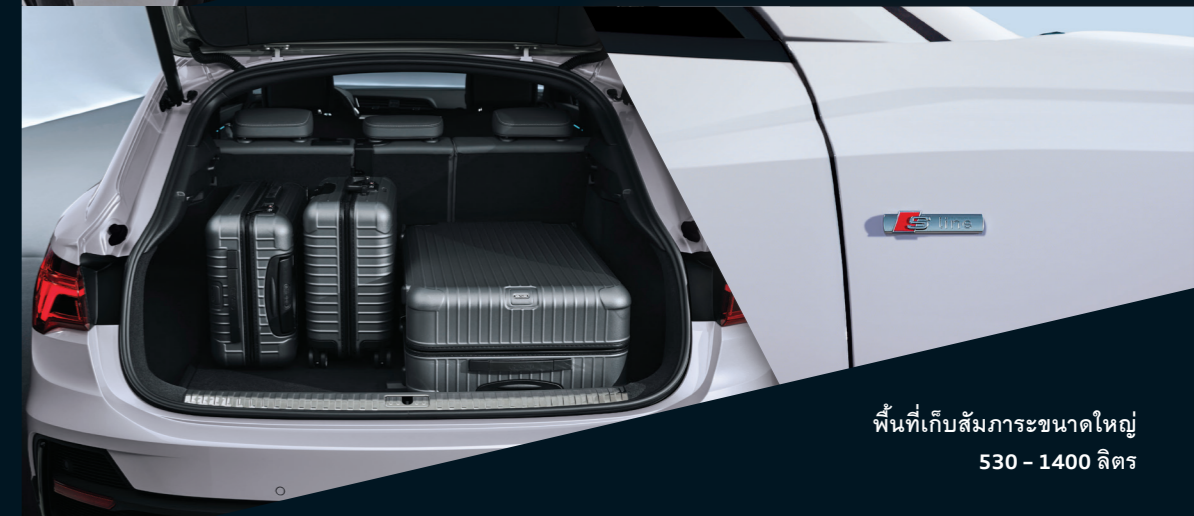
พื้นที่เก็บสัมภาระขนาดใหญ่ 530 - 1400 ลิตร