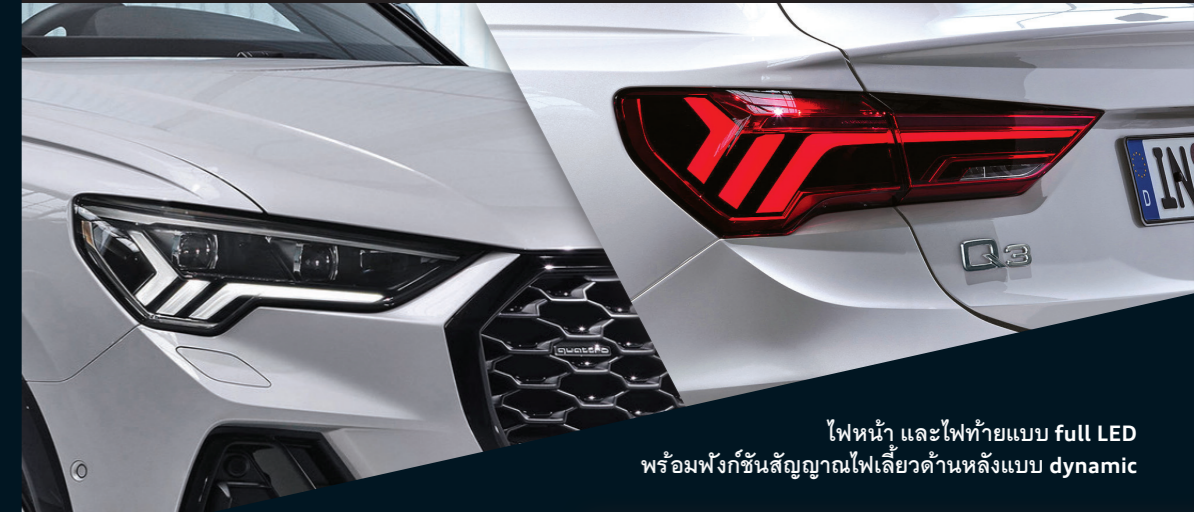
ไฟหน้า และไฟท้ายแบบ full LED พร้อมฟังก์ชันสัญญาณไฟเลี้ยวด้านหลังแบบ dynamic