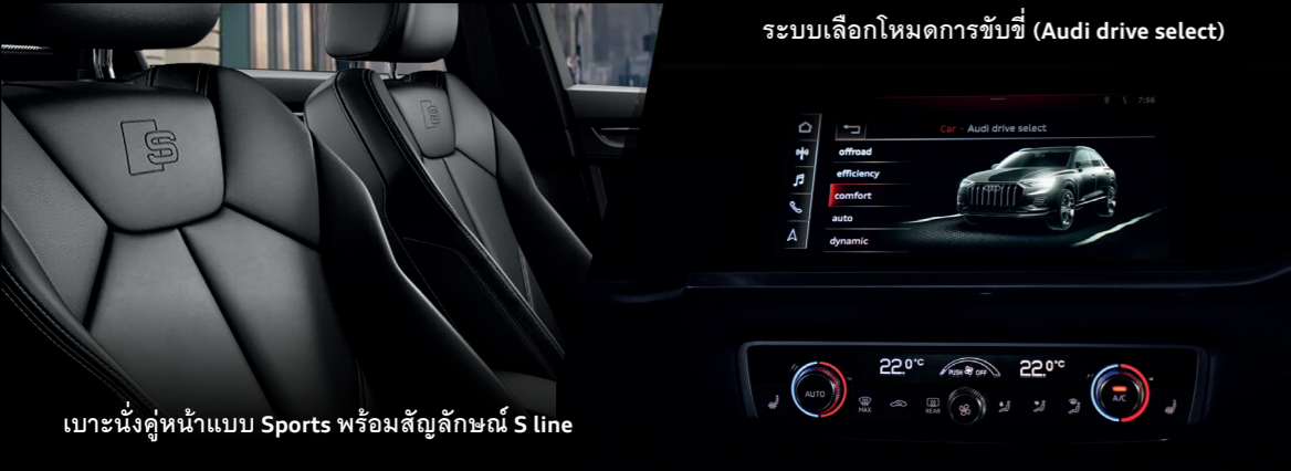
ระบบเลือกโหมดการขับขี่ (Audi drive select)