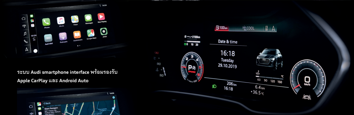
ระบบ Audi smartphone interface พร้อมรองรับ Apple CarPlay และ Android Auto