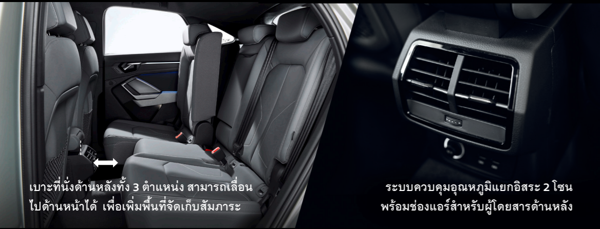
เบาะที่นั่งด้านหลังทั้ง 3 ตำแหน่ง สามารถเลื่อนไปด้านหลังได้ เพื่อเพิ่มพื้นที่จัดเก็บสัมภาระ