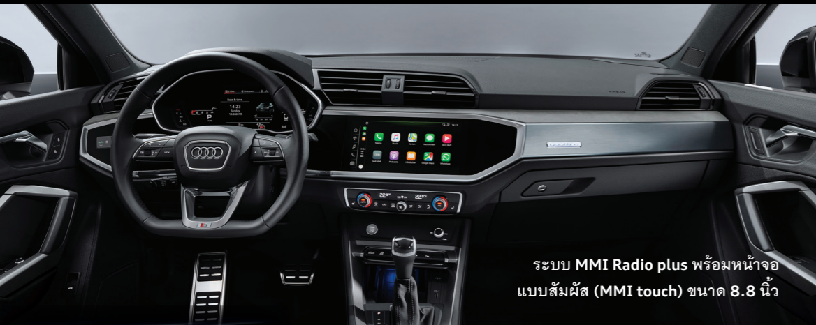
ระบบ MMI Radio plus พร้อมหน้าจอแบบสัมผัส (MMI touch) ขนาด 8.8 นิ้ว