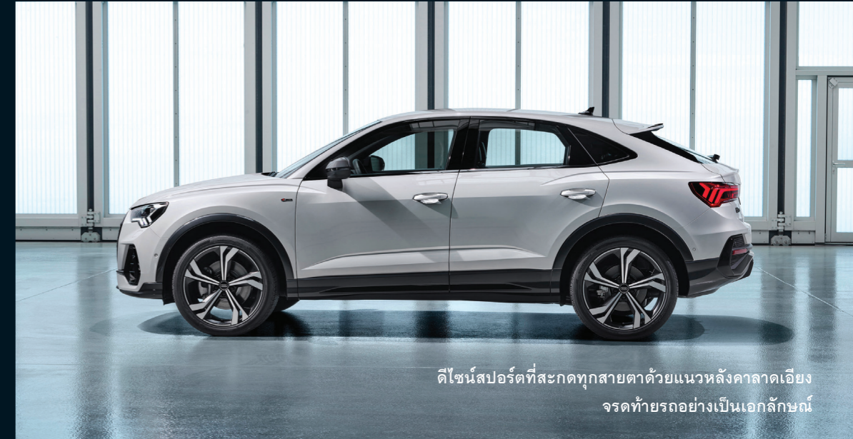
ดีไซน์สปอร์ตที่สะกดทุกสายตาด้วยแนวหลังคาลาดเอียง จรดท้ายรถอย่างเป็นเอกลักษณ์