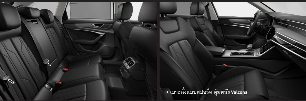
▶ เบาะนั่งแบบสปอร์ต หุ้มหนัง Valcona