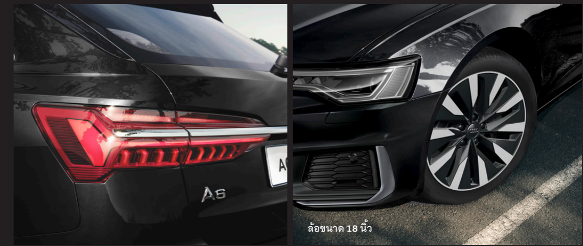
ล้อขนาด 18 นิ้ว