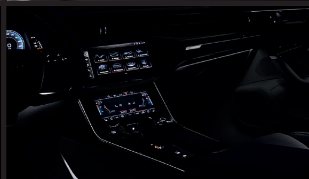
▶ ไฟเรืองแสงในห้องโดยสารสีขาว (White LED lighting package)