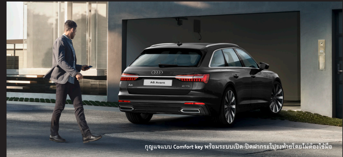
กุญแจแบบ Comfort key พร้อมระบบเปิด-ปิดฝากระโปรงท้ายโดยไม่ต้องใช้มือ