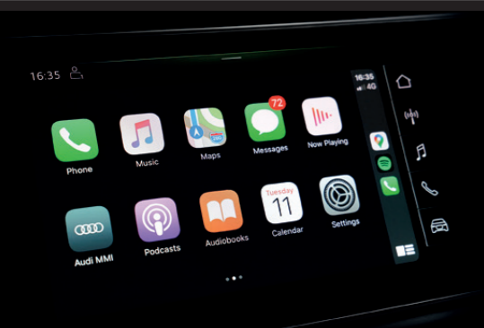
▶ ระบบ Audi smartphone interface พร้อมรองรับ Apple CarPlay และ Android Auto