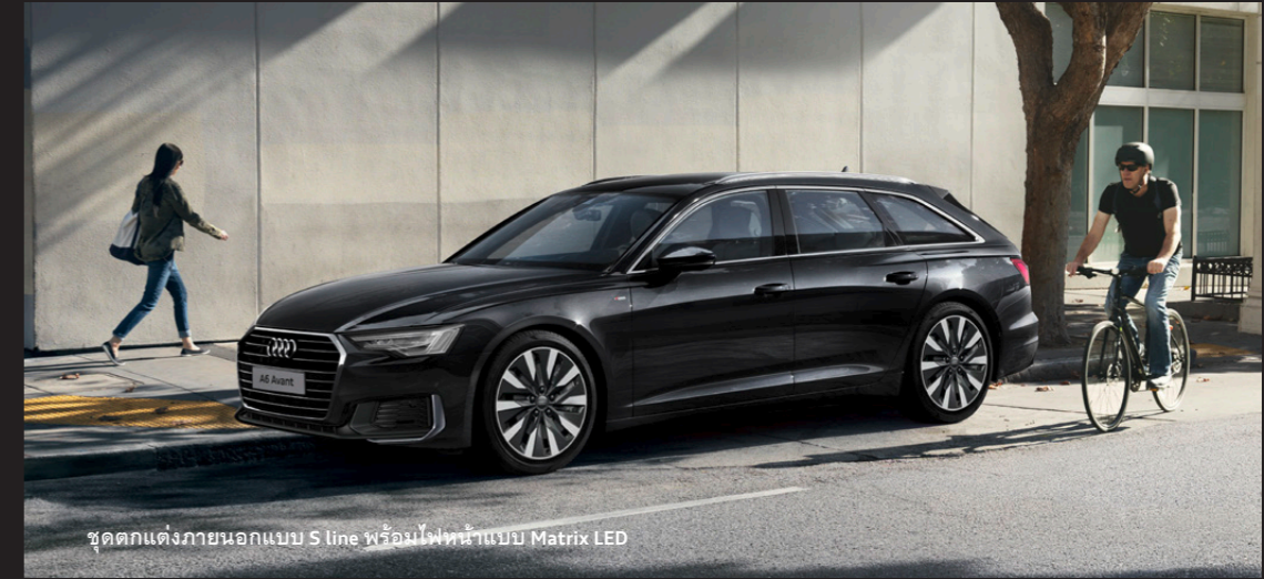
ชุดตกแต่งภายนอกแบบ S line พร้อมไฟหน้าแบบ Matrix LED