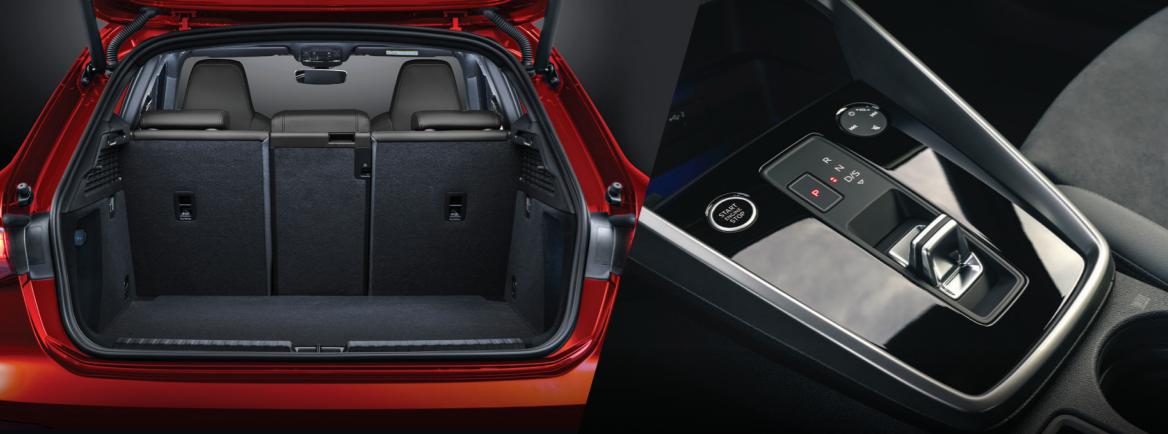
พื้นที่เก็บสัมภาระ ขยายได้ถึง 380 - 1200 ลิตร