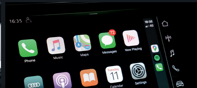
ระบบ MMI Radio plus พร้อมหน้าจอแบบสัมผัส (MMI touch) ขนาด 10.1 นิ้ว