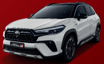
PLATINUM WHITE PEARL / BLACK ROOF