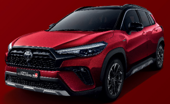
RED MICA METALLIC / BLACK ROOF