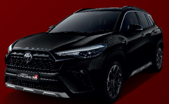
ATTITUDE BLACK MICA