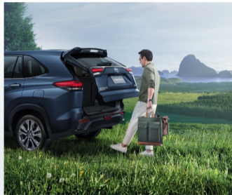
พื้นที่เปิด - เปิดด้วยแป้นไฟฟ้า พร้อมระบบอัตโนมัติ Kick Activated