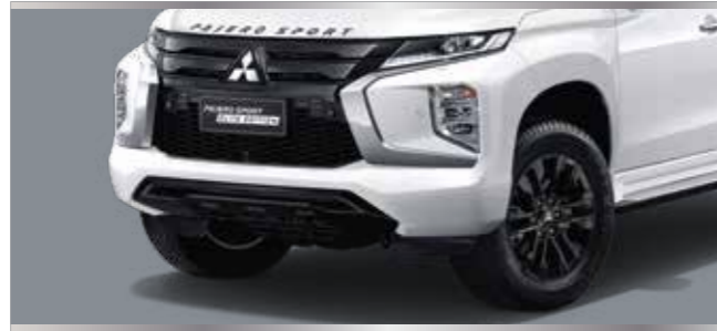
กรงจิ้งหรีดกรง พร้อมชุดตกแต่งใต้กันชนหน้าสีดำ และล้ออัลลอยสีต่างขนาด 18 นิ้ว