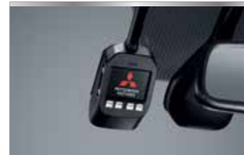
กล้องบันทึกภาพหน้ารถ DVR (Digital Video Recorder)