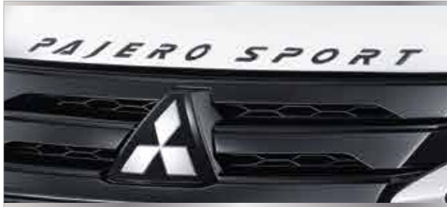
สัญลักษณ์ "PAJERO SPORT" บนฝากระโปรงหน้า

ที่สุดแห่งความโดดเด่น ทุกมุมมองคือเอกลักษณ์ที่แตกต่าง ด้วยดีไซน์สปอร์ตพรีเมียมในแบบคุณ