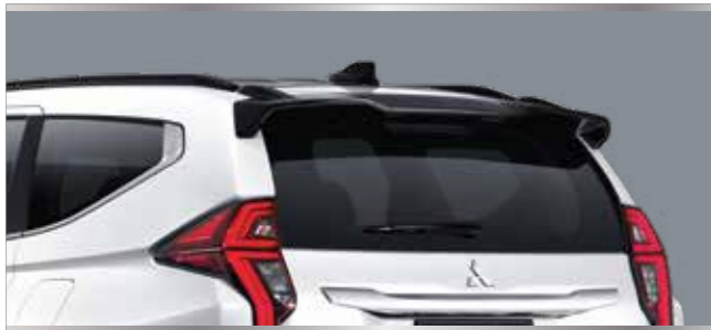
สปอยเลอร์หลัง พร้อมหลังคาสีดำ และเสาอากาศแบบ Shark Fin