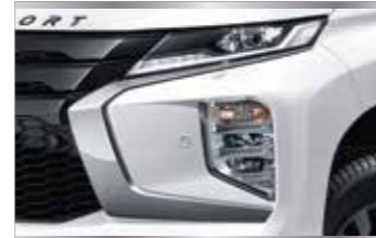
ไฟหน้าโปรเจกเตอร์ธรรมดา แบบ BI-LED พร้อมระบบปรับระดับแสงไฟอัตโนมัติ