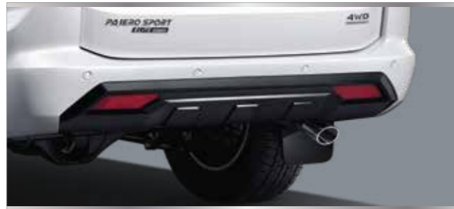
สัญลักษณ์รุ่นพิเศษ "ELITE EDITION" บริเวณประตูท้าย พร้อมชุดตกแต่งใต้กันชนหลังสีดำ ปลายท่อไอเสียสแตนเลส