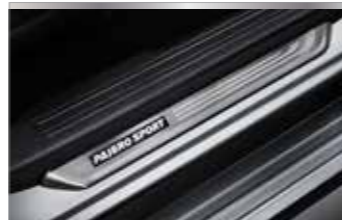
ฝาครอบสแตนเลสพร้อมไฟ LED