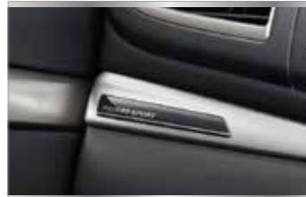
สัญลักษณ์ "PAJERO SPORT" เหนือกล่องเก็บของด้านหน้า