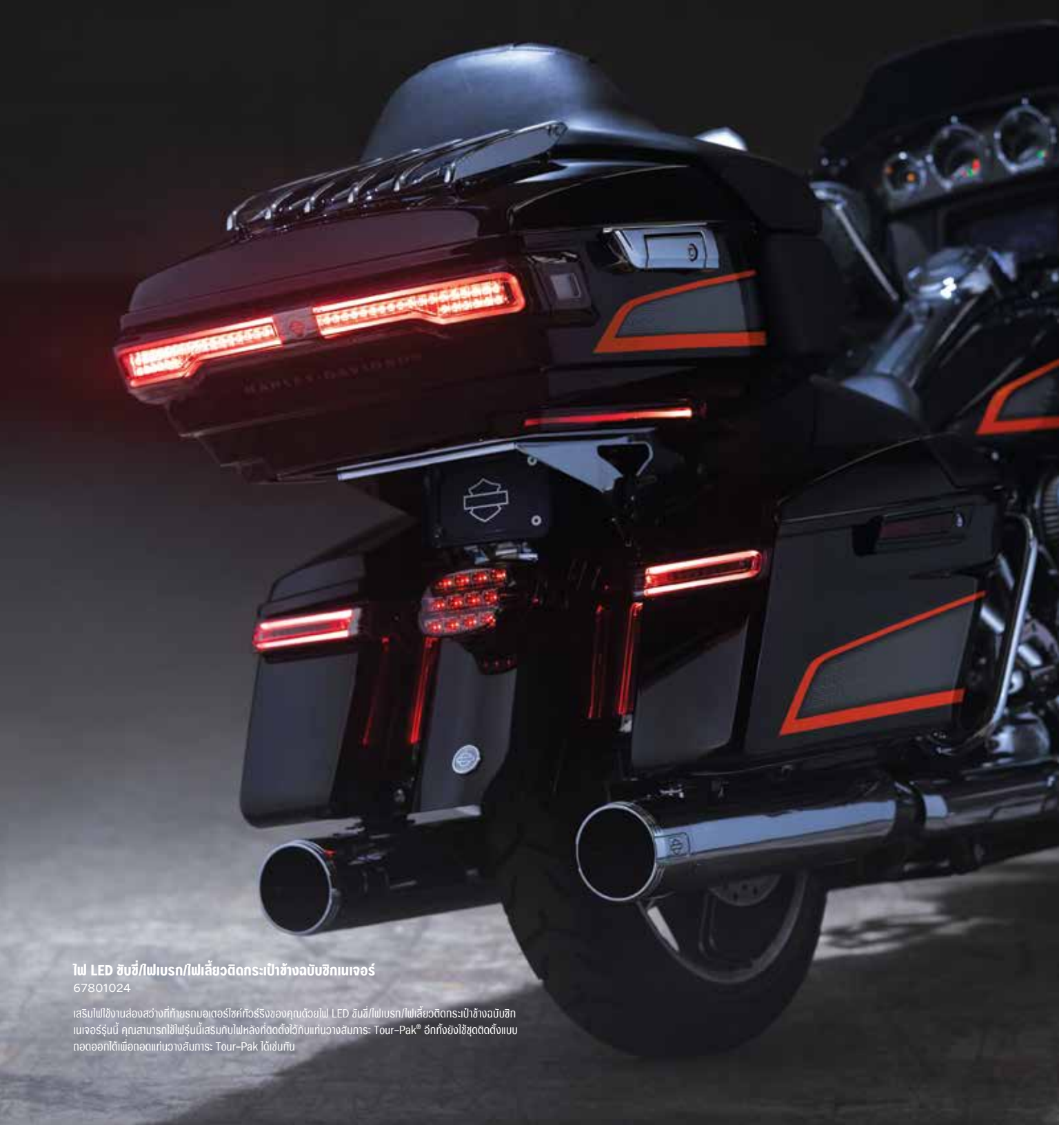
ไฟ LED ขั้วซี/ไฟเบรก/ไฟเลี้ยวติดกระเปาะข้างบับซิกเนเจอร์ 67801024

เสริมไฟใช้งานส่องสว่างที่ทำयरมอเตอร์ไซด์ของคุณด้วยไฟ LED ขั้วซี/ไฟเบรก/ไฟเลี้ยวติดกระเปาะข้างบับซิกเนเจอร์รุ่นนี้ คุณสามารถใช้ไฟรุ่นนี้เสริมกับไฟหลังที่ติดตั้งไว้กับแวนางสินค้า: Tour-Pak® อีกทั้งยังใช้ชุดติดตั้งแบบถอดออกได้เพื่อถอดแวนางสินค้า: Tour-Pak ได้เช่นกัน