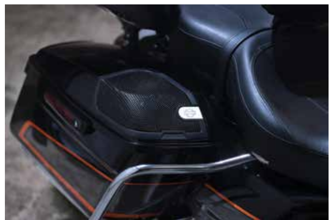
HARLEY-DAVIDSON® AUDIO POWERED BY ROCKFORD FOSGATE - ลำโพง STAGE II สำหรับกระเปาะข้าง 76000987

คอลเลกชัน Ride Free เติมน้ำมันให้กับการผจญภัยในโลกแห่งเปิดถนนที่เปิดกว้าง และเรียกร้องให้เรากลับไปสู่ความค้นหา และเป็นหนึ่งเดียวด้วยความรักในการขับขี่รถมอเตอร์ไซด์ คอลเลกชันนี้ได้แรงบันดาลใจจากประโยชน์ชื่อของ Willie G. Davidson และจะสืบสานขบวนการต่อไป