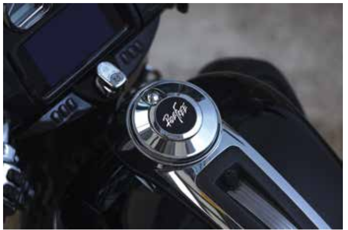
ฝาเปิดคอนโซลถังน้ำมัน RIDE FREE 70900843

เลนส์สีในขอบแทนไฟ LED สีอำพันที่จะส่องสว่างเป็นไฟขั้วซีเมื่อติดเครื่อง ขณะขี่กลุ่มไฟวงนอก 2 ดวงจะทำหน้าที่เสริมเป็นไฟบอกทิศทางเมื่อเปิดไฟเลี้ยว