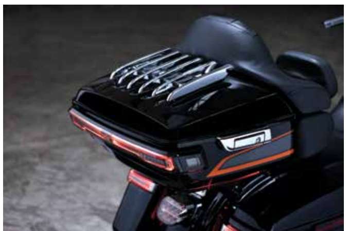
รางสินค้า: STEALTH TOUR-PAK 53000242

ก้าวไปอีกขั้นเพื่อสัมผัสสุดยอดประสบการณ์เสียงของมอเตอร์ไซด์ ลำโพงรุ่นนี้ให้เสียงสูงคมชัดเพิ่มขึ้น เสียงกลางที่นิยมสุด ๆ และเสียงทุ้มที่สะท้อนพื้นดินลำโพงขยายเสียง 3 ทิศทางรุ่นนี้มากับลำโพงเสียงทุ้มแบบติดตั้งบนที่ถนน พร้อมลำโพงเสียงกลางและเสียงแหลมแบบ Bridge-Mounted แยกต่างหาก