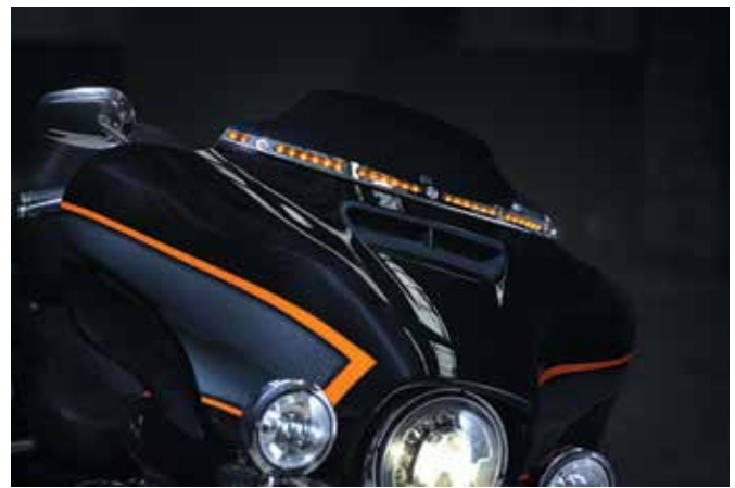
ขอบแต่งซิลด์บึงลมติดไฟสว่าง 57000394A

เลนส์สีในขอบแทนไฟ LED สีอำพันที่จะส่องสว่างเป็นไฟขั้วซีเมื่อติดเครื่อง ขณะขี่กลุ่มไฟวงนอก 2 ดวงจะทำหน้าที่เสริมเป็นไฟบอกทิศทางเมื่อเปิดไฟเลี้ยว