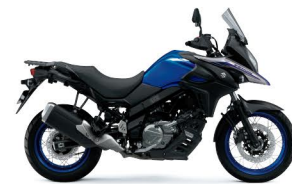
Pearl Vigor Blue / Metallic Mat Sword Silver (CFR)