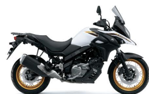
Pearl Brilliant White (YUH)