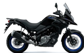
Glass Sparkle Black (YVB)

Specifications, appearance, colors (including body color), equipment, materials and other aspects of the "SUZUKI" products shown in this catalogue are subject to change by SUZUKI at any time without notice, and they may vary depending on local conditions or requirements. Some models are not available in some regions. Each model may be discontinued without notice. Please inquire at your local dealer for details of any such changes.