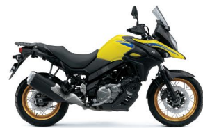
Champion Yellow No.2 (YU1)