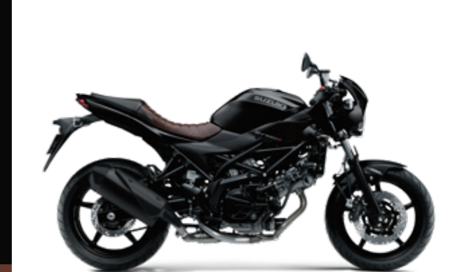
Glass Sparkle Black (YVB)