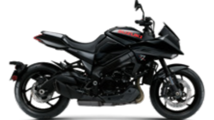
Glass Sparkle Black (YVB)