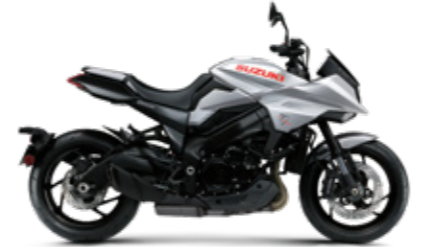
Metallic Mystic Silver (YMD)