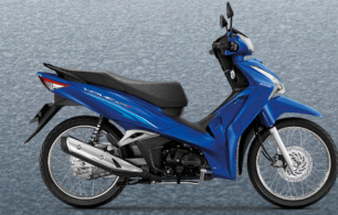
น้ำเงิน-ดำ (BUB)