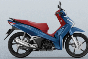
น้ำเงิน-แดง (BUR)