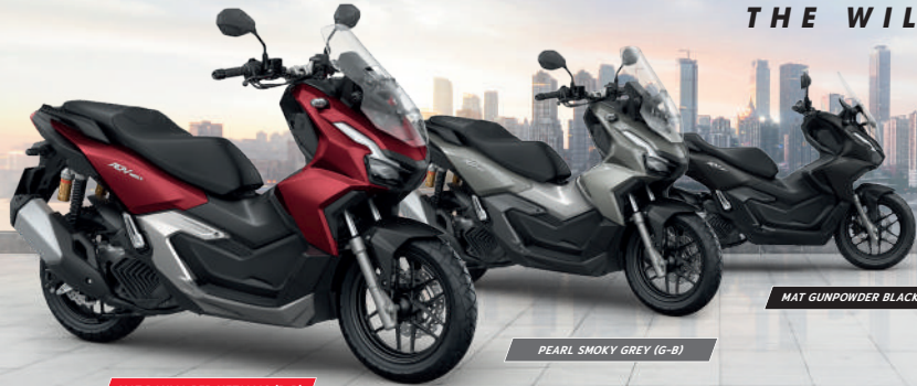
MAT DAHLIA RED METALLIC (R-B)

มีทางใหม่ ให้ท้าทายทุกวัน Honda SUV BIKE