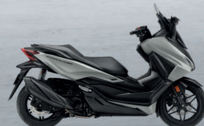
STORMY GREY G-B (Grey-Black) เทา-ดำ