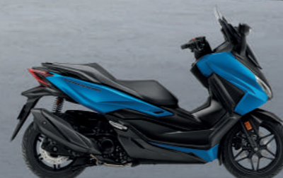
ENERGETIC BLUE BUB (Blue-Black) น้ำเงิน-ดำ