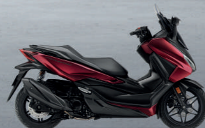
SOLAR RED R-B (Red-Black) แดง-ดำ