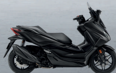
ECLIPSE BLACK BLK (BLACK) ดำ