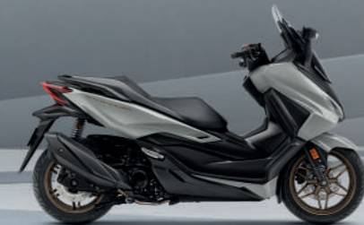
STORMY GREY G-B (Grey-Black) เทา-ดำ