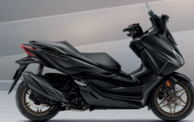
ECLIPSE BLACK BLK (BLACK) ดำ