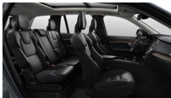
Charcoal Moritz leather and Linear Walnut Decor

Some parts of upholstery are mixed with leatherette. บางชิ้นส่วนของเบาะโดยสารมีส่วนผสมของหนังสังเคราะห์