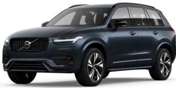
Denim Blue Metallic