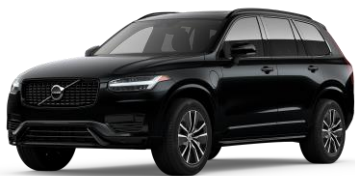
Onyx Black Metallic