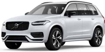
Crystal White Premium Metallic