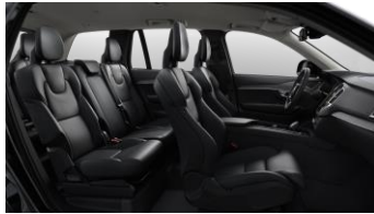
Charcoal ventilated Nappa leather and Grey Ash decor