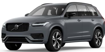
Thunder Grey Metallic