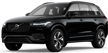
Onyx Black Metallic