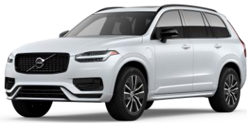
Crystal White Premium Metallic