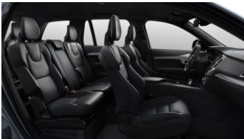
Charcoal Nubuck textile/ fine Nappa leather and Metal Mesh decor