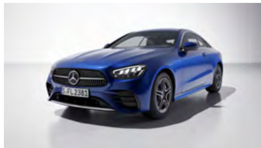
896U brilliant blue