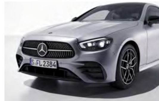
P55 Night package