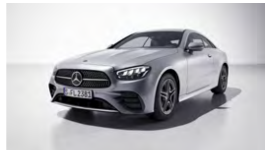
922U high-tech silver