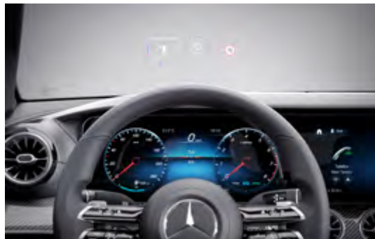
463 Head-up display