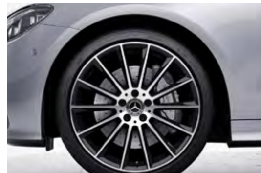
20" AMG multi-spoke alloy wheels (RVR)

* ตัวอย่างสีอาจแตกต่างจากสีรถของจริง เนื่องจากระบบการพิมพ์