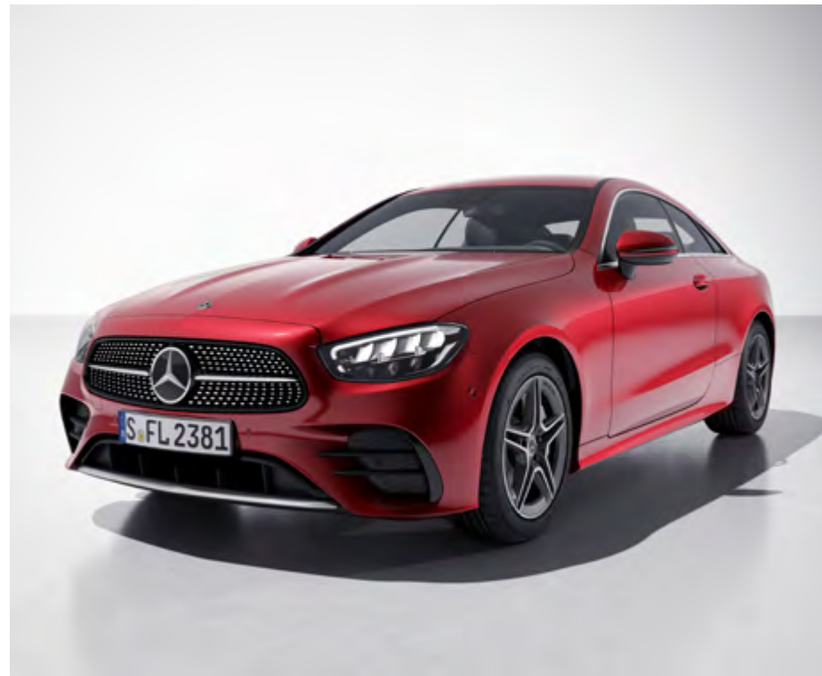
993U designo patagonia red bright

*ตัวอย่างสีอาจแตกต่างจากสีรถของจริง เนื่องจากระบบการพิมพ์