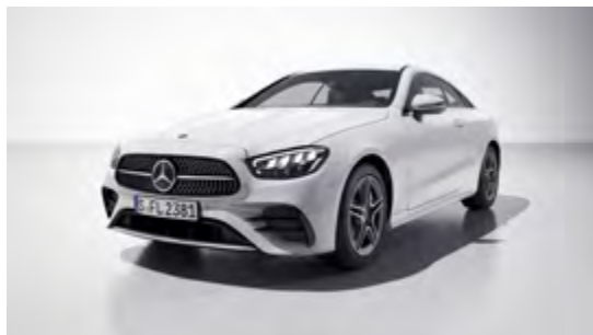
149U polar white