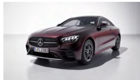
660U rubellite red

*ตัวอย่างสีอาจแตกต่างจากสีรถของจริง เนื่องจากระบบการพิมพ์