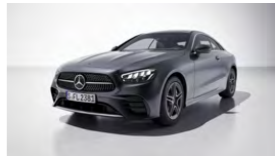
992U selenite grey