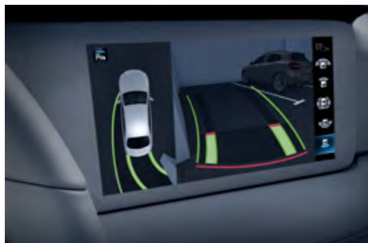
P47 360° camera