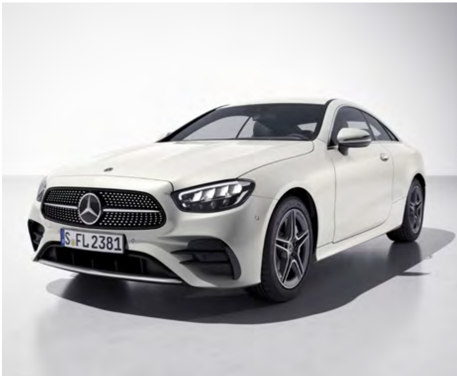
885U designo opalite white bright