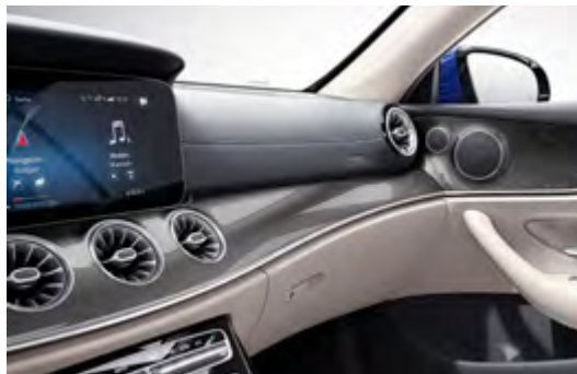
H64 Metal-weave trim