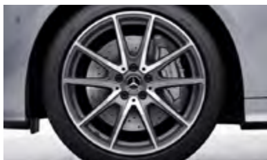
19" AMG 10-spoke (RDD)

*ตัวอย่างสีอาจแตกต่างจากสีรถของจริง เนื่องจากระบบการพิมพ์