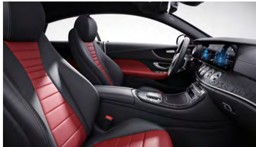
297A classic red / black