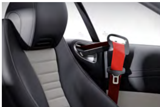
Y05 designo seat belts in red