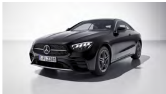
197U obsidian black