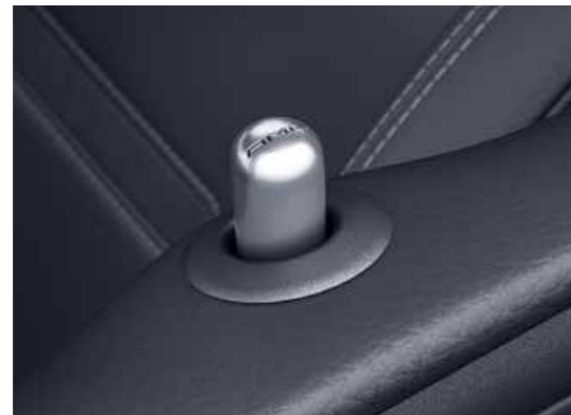
ปุ่มกดล็อกประตู AMG แบบกลม A000 766 0800 (x4)