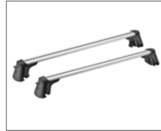
แร็คหลังคา A167 890 30 00