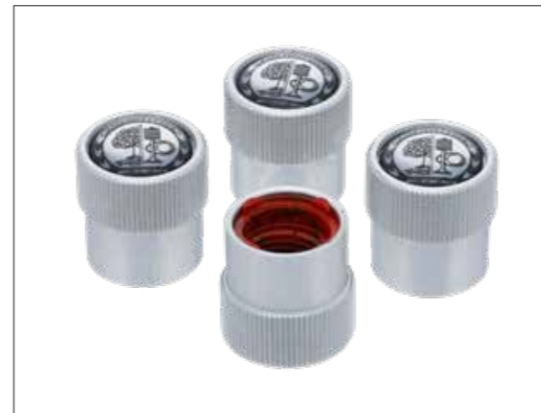
ฝาปิดที่เติมลมยาง ลาย AMG 4 ชิ้น B6 647 20 05