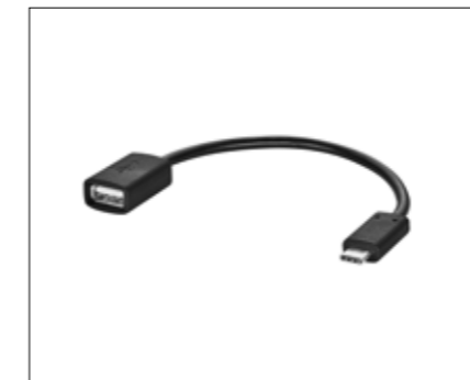
สาย Media interface adapter USB type A & type C A177 820 29 01