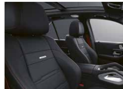
651 DINAMICA microfibre AMG-black