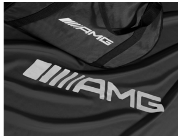
ผ้าคลุมรถกันฝุ่น (ใช้ในที่ร่ม) A167 899 26 00