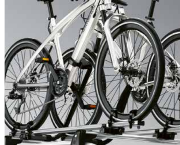
แร็คจักรยาน สำหรับจักรยาน 1 คัน A000 890 02 93 และชุดสกรูเสริมแร็ค สำหรับจักรยาน 1 คัน A002 990 03 99