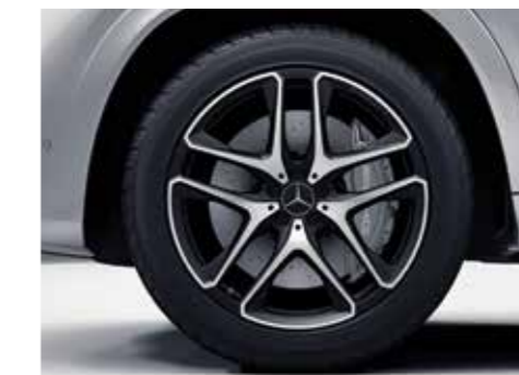
RWE ล้ออัลลอย แบบ AMG 5 - twin - spoke สีดำ ขนาด 21"