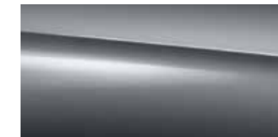
992 selenite grey