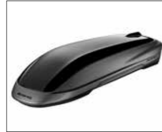
กล่องใส่สัมภาระบนหลังคา AMG A000 840 09 00