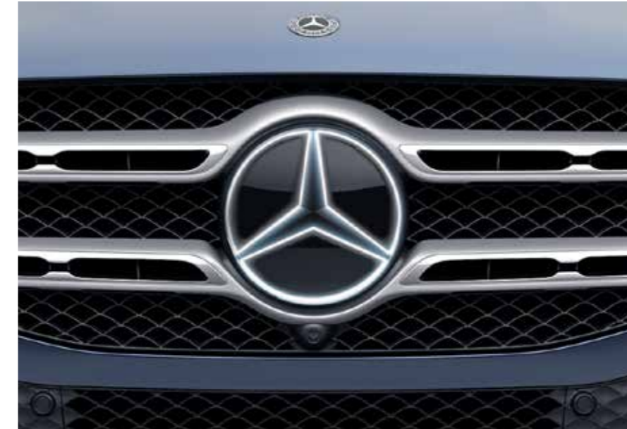
ชุดดาวบนกระจหน้าแบบมีไฟ กรุณาสอบถามรหัสสินค้าและข้อมูลที่ผู้จำหน่ายฯ อย่างเป็นทางการ