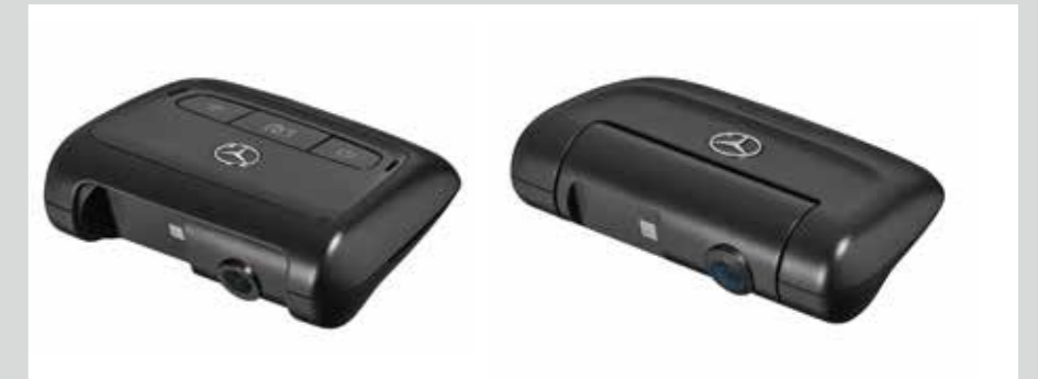
ชุดกล้องติดรถยนต์ Mercedes-Benz Dashcam พร้อมระบบ Radar และระบบ G-sensor กรุณาสอบถามรหัสสินค้าและข้อมูลที่ผู้จำหน่ายฯ อย่างเป็นทางการ