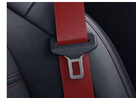
Y05 Design seat belts in red