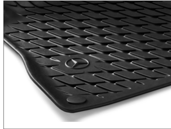
ยางปูพื้นสำหรับผู้ขับขี่และผู้โดยสารด้านหน้า A167 680 66 06/9G33 ยางปูพื้นสำหรับผู้โดยสาร แถวที่2 A167 680 72 06/9G33 ยางปูพื้นสำหรับผู้โดยสาร แถวที่3* A167 680 75 06/9G33