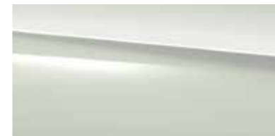
149 polar white