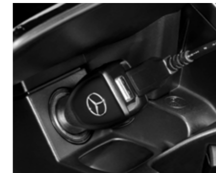
อุปกรณ์ Power charge A213 820 24 03