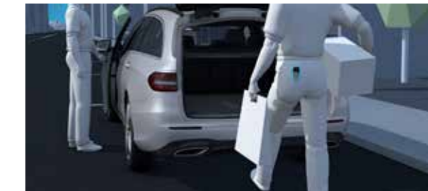
ระบบกุญแจแบบ KEYLESS-GO comfort package