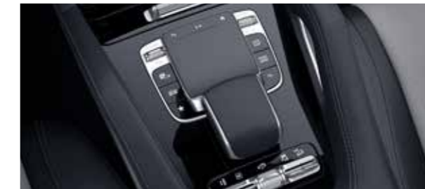
ระบบควบคุมและสั่งงานด้วย Touchpad