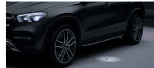
ไฟส่องทางใต้กระจกมองข้างเป็นรูปตราสัญลักษณ์เมอร์เซเดส-เบนซ์ *เฉพาะรุ่น GLE 300 d 4MATIC AMG Dynamic