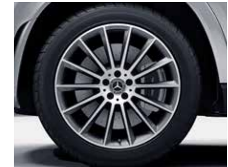
ล้ออัลลอยดีไซน์สปอร์ตจาก AMG แบบ Multi-spoke ขนาด 21"