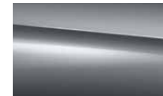
992 selenite grey