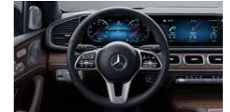
พวงมาลัยมัลติฟังก์ชัน