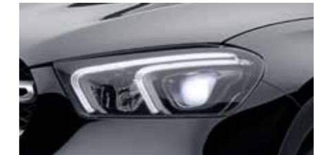
LED High Performance headlamps