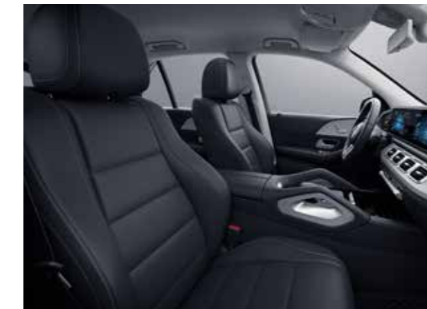
111A ARTICO man-made leather black