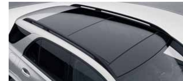
หลังคาพาโนรามิคชั้นรูฟ เลื่อนเปิด-ปิดได้ด้วยระบบไฟฟ้า *เฉพาะรุ่น GLE 300 d 4MATIC AMG Dynamic