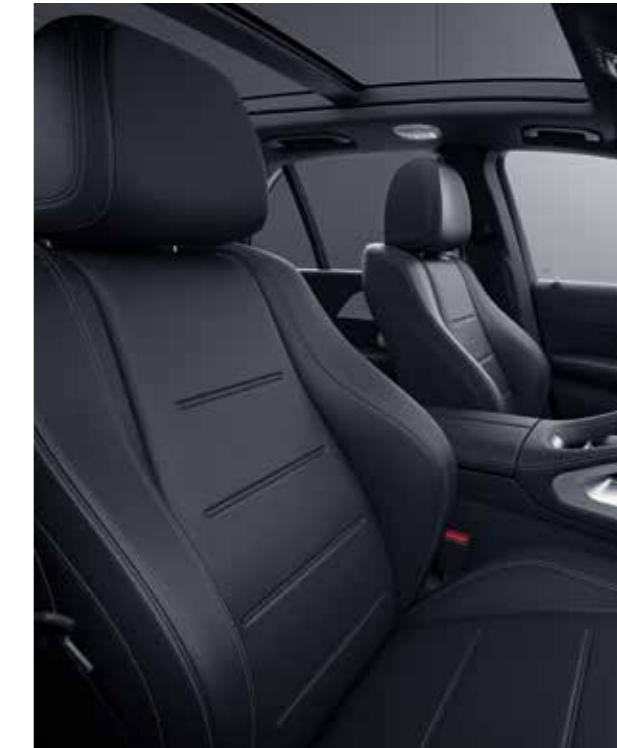
801A nappa leather / leather black