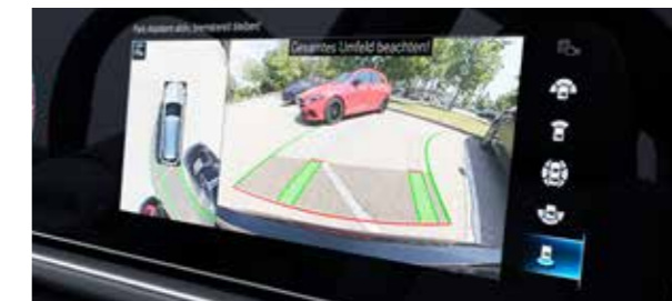
ระบบช่วยนำรถเข้าจอดอัตโนมัติ (Active Parking Assist with PARKTRONIC) *เฉพาะรุ่น GLE 300 d 4MATIC AMG Dynamic มาพร้อมกล้องแสดงภาพรอบทิศทาง