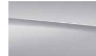
922 high-tech silver