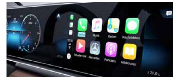
ฟังก์ชันเชื่อมต่อโทรศัพท์มือถือระบบปฏิบัติการ iOS และ Android (Apple CarPlay™ & Android Auto)