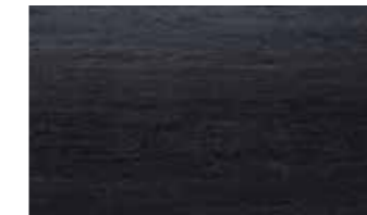
H31 Anthracite open - pore oak wood