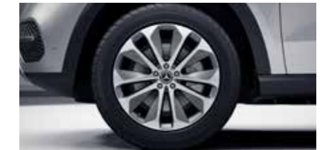
ล้ออัลลอย แบบ 5 ก้าน คู่ขนาด 20"