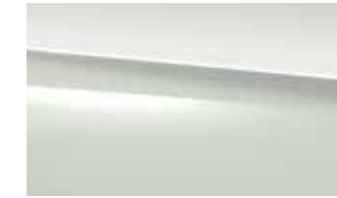
149 polar white