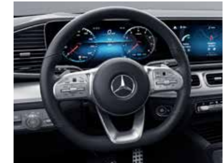
พวงมาลัยมัลติฟังก์ชันแบบสปอร์ต หุ้มหนัง Nappa พร้อมปุ่มควบคุมแบบ Touch Control