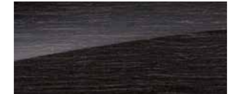
H18 High-gloss anthracite lime wood trim