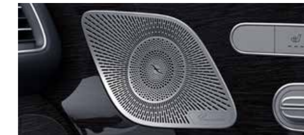
ระบบเสียงรอบทิศทาง Burmester® *เฉพาะรุ่น GLE 300 d 4MATIC AMG Dynamic