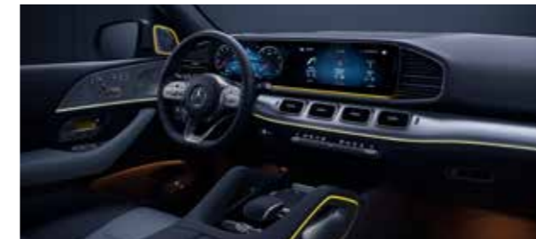
ไฟเรืองแสงล้อมรอบห้องโดยสารแบบ 64 เชนดสี