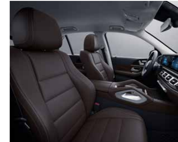
134A ARTICO man-made leather espresso brown / black