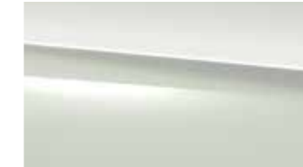
149 polar white