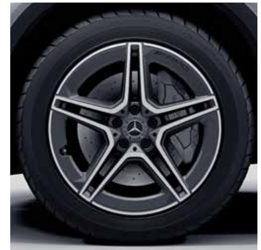
ล้ออัลลอยด์ดีไซน์สปอร์ตจาก AMG แบบ 5 ก้านคู่ ขนาด 19" ตกแต่งด้วยสีดำ

ถ่ายทอดความเป็น AMG Line ได้อย่างครบถ้วนไม่ว่าจะเป็นการออกแบบภายนอกที่มีความสปอร์ต และสัมผัสได้ถึงพลังกำลัง นอกจากนี้ยังอัดแน่นด้วยสมรรถนะระดับสูง ที่ช่วยให้คุณขับเคลื่อนได้อย่างมั่นใจ และเพลิดเพลินร่าเริงได้อย่างเต็มพิกัด