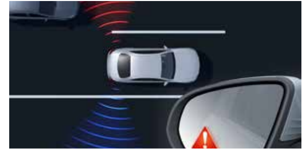
ระบบช่วยเตือนขณะเปลี่ยนช่องจราจร (Blind Spot Assist)