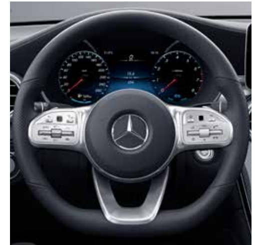
พวงมาลัยผลิตฟังก์ชัน sport steering wheel พร้อมปุ่มควบคุมแบบ Touch Control