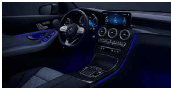
ไฟเรืองแสงล้อมรอบห้องโดยสารปรับได้ 64 เฉดสี (Ambient Lighting)