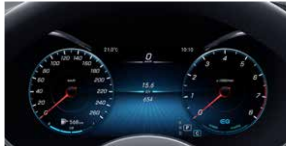
มาตรวัดความเร็ว และวัดรอบเครื่องยนต์แบบ All-Digital Instrument Display ขนาด 12.3 นิ้ว