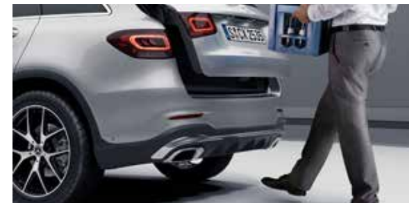
ระบบกุญแจแบบ KEYLESS-GO พร้อมระบบเปิด-ปิดบานประตูท้ายอัตโนมัติโดยไม่ต้องใช้มือ