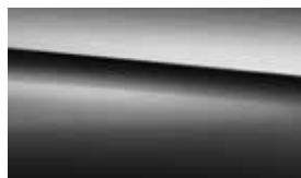
197 obsidian black