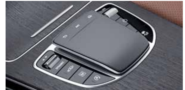
ระบบควบคุม และสั่งงานแบบสัมผัส (Touchpad)