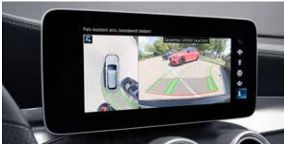
ระบบช่วยการนำรถเข้าจอดอัตโนมัติ พร้อมกล้องแสดงภาพรอบทิศทางขณะถอยจอด*