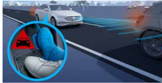
ระบบช่วยเบรกแบบแอคทีฟ (Active Brake Assist)