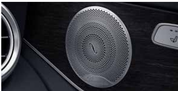
ระบบเสียงรอบทิศทาง Burmester®*