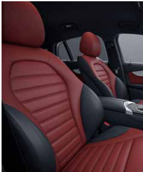
297 Leather, two-tone- cranberry red / black