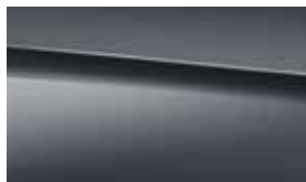
831 graphite grey