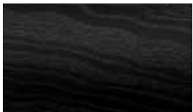
736 Open-pore black ash wood trim