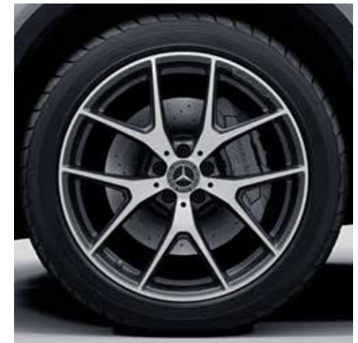
ล้ออัลลอยด์ดีไซน์สปอร์ตจาก AMG แบบ 5 ก้านคู่ ขนาด 20" ตกแต่งด้วยสี tremolite grey

ล้ำและแรงไปอีกขั้น ด้วยการทำงานร่วมกันของเครื่องยนต์เบนซิน และมอเตอร์ไฟฟ้า ที่ช่วยเพิ่มประสิทธิภาพการขับขี่ให้ดียิ่งขึ้นกว่าเดิม และยังสามารถพาคุณทะยานไปได้ไกลกว่าที่เคย ด้วยพลังงานไฟฟ้าเต็มรูปแบบ