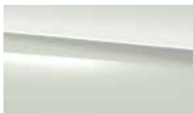
149 polar white