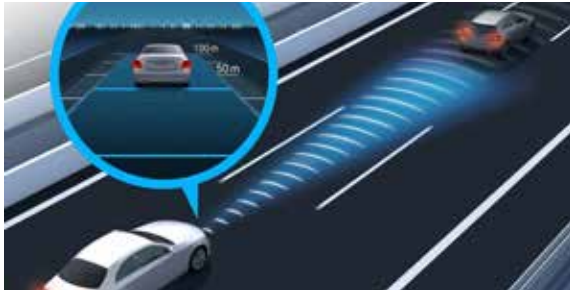
ระบบช่วยรักษาระยะห่างจากรถคันหน้า (Active Distance Assist DISTRONIC)*