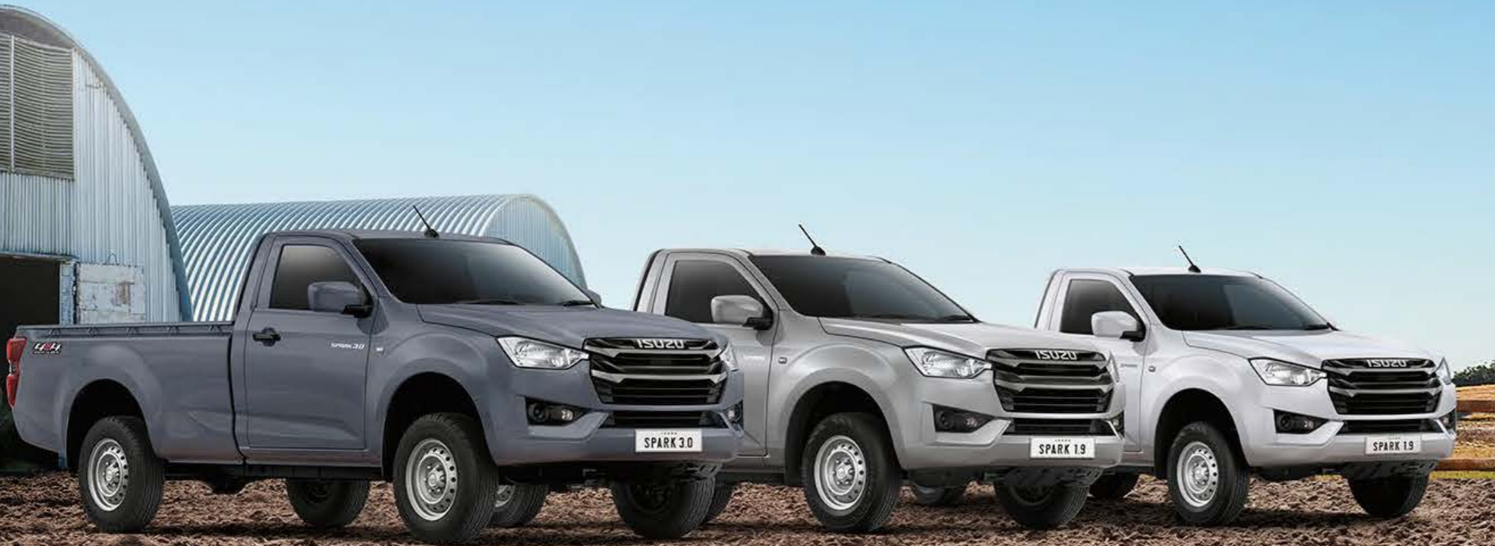
Islay Gray Opaque