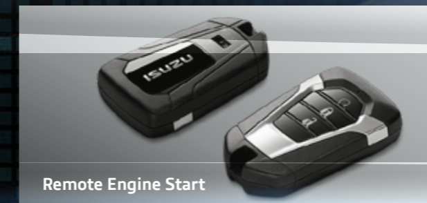
Remote Engine Start