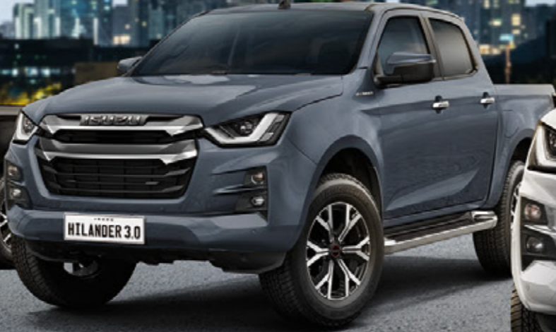
Islay Gray Opaque