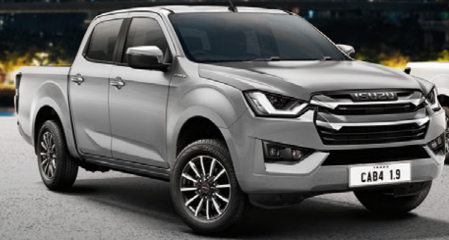
Bohemian Silver Metallic