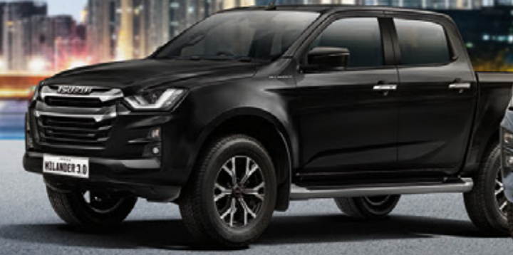
Bavarian Black Mica