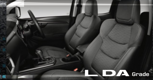
L DA Grade