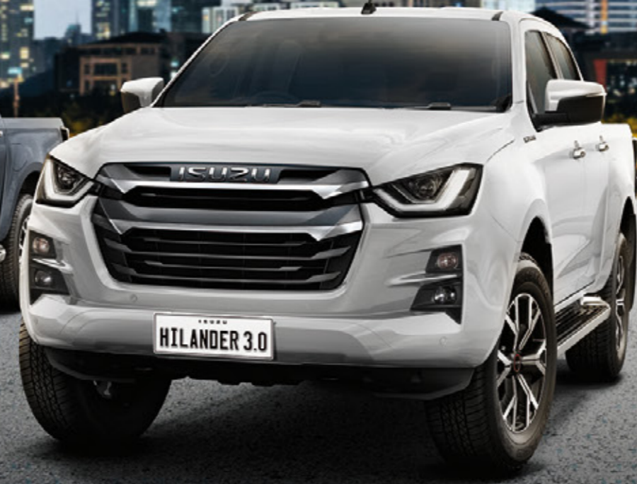
Dolomite White Pearl