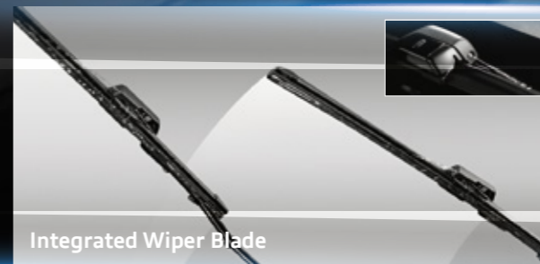
Integrated Wiper Blade