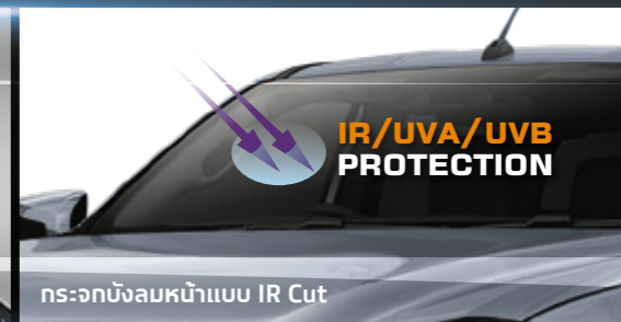
กระจกบังลมหน้าแบบ IR Cut