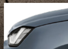
Islay Gray Opaque

หลากหลายเลือกได้ ในแบบที่ตอบโจทย์ธุรกิจคุณ