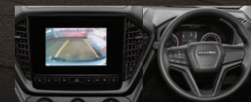
ใหม่! ห้องโดยสารในรุ่น S DA