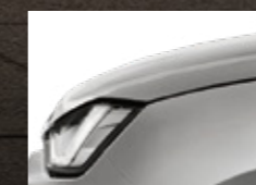
Bohemian Silver Metallic