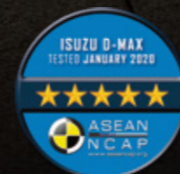
มาตรฐานความปลอดภัยระดับ 5 ดาว จาก ASEAN NCAP