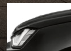
Bavarian Black Mica