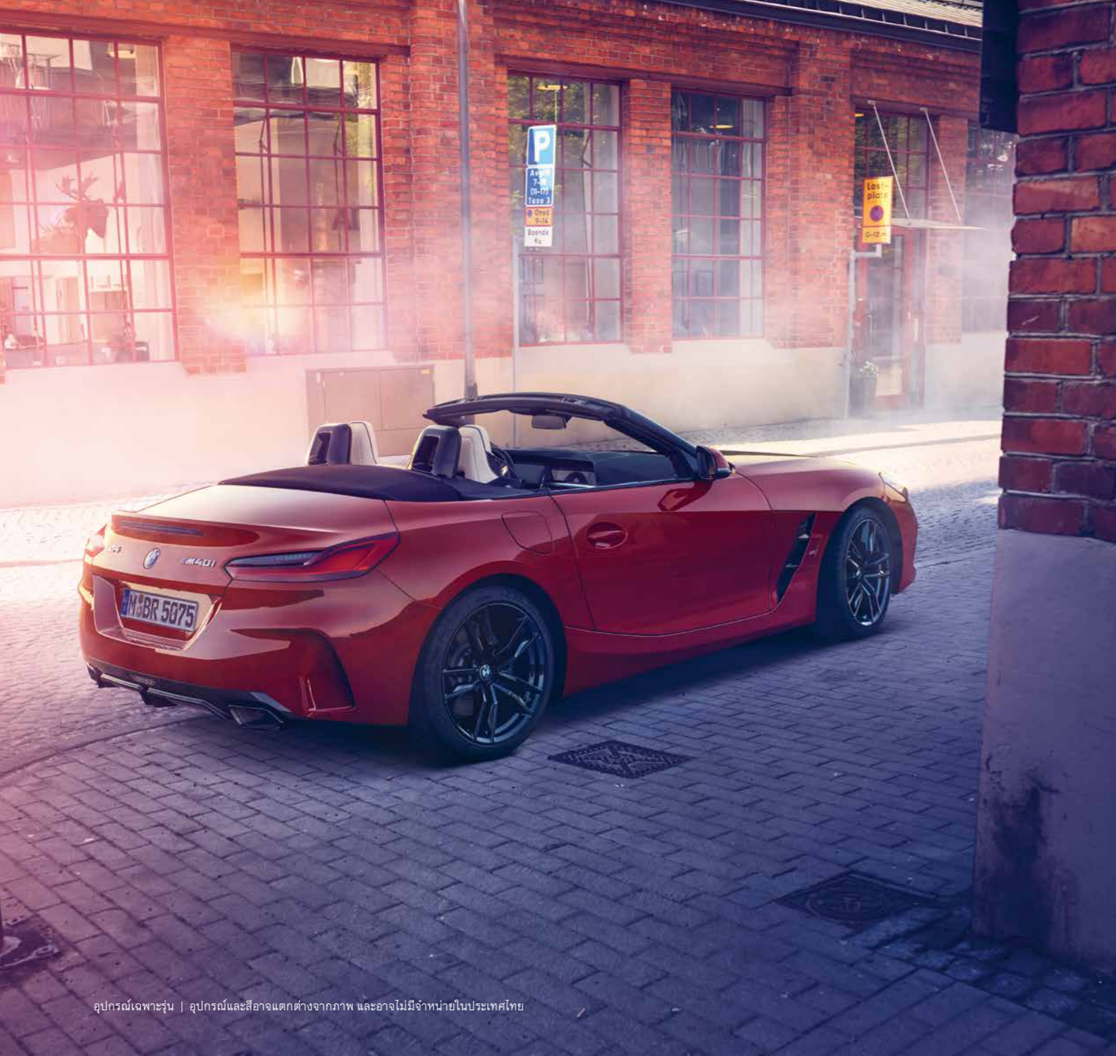
อุปกรณ์เฉพาะรุ่น | อุปกรณ์และสีอาจแตกต่างจากภาพ และอาจไม่มีจำหน่ายในประเทศไทย