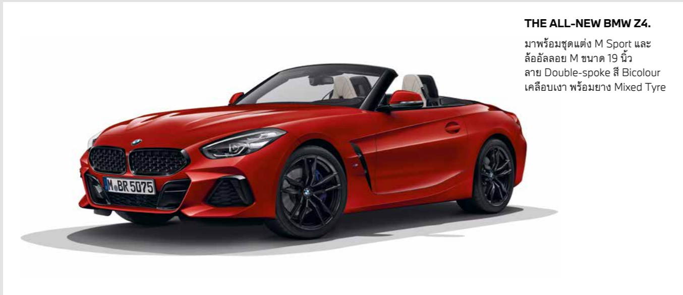
THE ALL-NEW BMW Z4. มาพร้อมชุดแต่ง M Sport และ ล้ออัลลอย M ขนาด 19 นิ้ว ลาย Double-spoke สี Bicolour เคลือบเงา พร้อมยาง Mixed Tyre