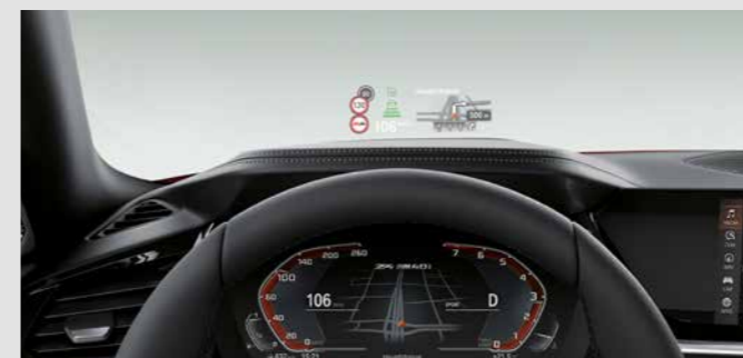
HEAD-UP DISPLAY. ระบบ BMW Head-up Display จะช่วยแสดงข้อมูลทั้งหมดที่เกี่ยวข้องกับการเดินทางให้ผู้ขับขี่มองเห็นได้อย่างชัดเจนในระดับสายตา