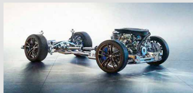
ADAPTIVE M SUSPENSION. ช่วงล่างสามารถปรับได้ด้วยระบบอิเล็กทรอนิกส์เพื่อให้เหมาะกับสภาพถนน และการขับขี่ในรูปแบบที่ต่างกันไป ผู้ขับขี่ยังสามารถปรับช่วงล่างผ่านทางระบบ Driving Experience Control ตามสไตส์ที่คุณต้องการ ไม่ว่าจะเป็นแบบที่ให้ความสะดักสบายไปจนถึงแข็งแกร่งสุดัน ทำให้การควบคุมรถได้คล่องตัวอย่างเหนือระดับ