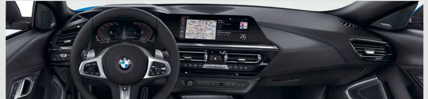
BMW LIVE COCKPIT PROFESSIONAL. มาพร้อมระบบแผนที่นำทาง รวมถึงหน้าจอแสดงผลคุณภาพสูงที่ประกอบไปด้วย จอภาพความละเอียดสูงขนาด 10.25 นิ้ว ใช้งานด้วยระบบสัมผัส และหน้าปัดมาตรวัดความเร็วแบบดิจิทัลในขนาดเดียวกัน