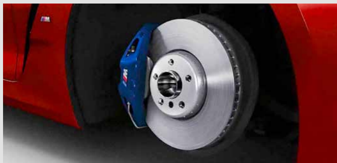
M SPORT BRAKE. เบรก M Sport มาพร้อมดิสก์เบรกกว้างและคาลิปเปอร์เบรกสีน้ำเงินสุดเอ็กซ์คลูซีฟพร้อมโลโก้ M