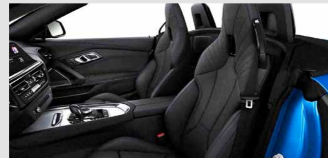
M SPORTS SEATS. เบาะนั่ง M Sport มาพร้อมพนักพิงศีรษะ รวมถึงพนักพิงหลังที่ลึกและยกสูง ทำให้รองรับการขับขี่ของผู้ขับและผู้โดยสารด้านหน้าได้อย่างดีเยี่ยม แม้ในขณะเลี้ยวโค้ง