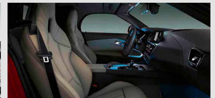
AMBIENT LIGHT. ชุดไฟเพิ่มบรรยากาศภายในห้องโดยสาร มีให้เลือกปรับรูปแบบไฟได้ถึง 11 แบบ และเลือกเปลี่ยนสีได้ถึง 6 สี ช่วยสร้างบรรยากาศภายในห้องโดยสารให้เต็มไปด้วยความอบอุ่น ผ่อนคลาย มาพร้อมไฟ Ambient Contour ที่แผงหน้าปัด ขอบประตู และคอนโซลกลาง