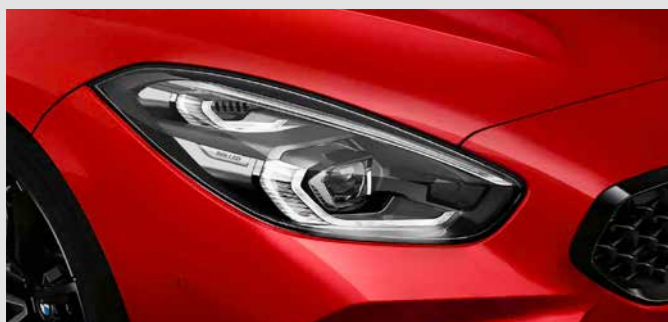
ADAPTIVE LED HEADLIGHTS. ระบบไฟหน้า LED อัจฉริยะ พร้อมฟังก์ชันปรับการทำงานไฟสูงอัตโนมัติ ช่วยทำให้มองเห็นได้ชัดเจนมากขึ้นในเวลากลางคืน