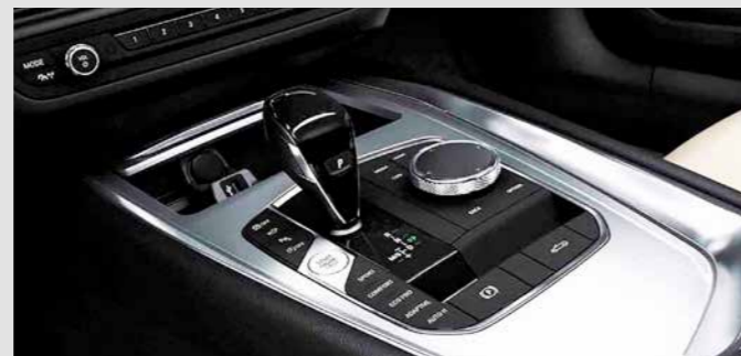
8-SPEED STEPTRONIC SPORT TRANSMISSION. เกียร์อัตโนมัติ 8 จังหวะแบบ Sport Steptronic ให้การเปลี่ยนเกียร์แบบสปอร์ตเต็มขั้นทั้งแบบอัตโนมัติและแบบแมนนวลด้วย Shift Paddles หรือคันเกียร์