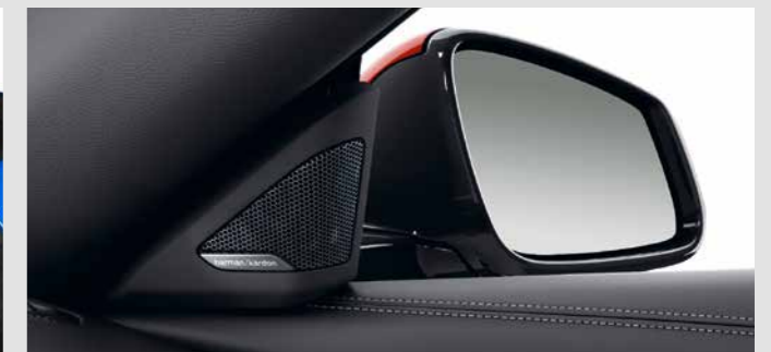
HARMAN KARDON SURROUND SOUND SYSTEM. ระบบเครื่องเสียงรอบทิศทาง Harman Kardon ให้กำลังเสียง 408 วัตต์ มาพร้อมระบบอีควอไลเซอร์และลำโพง 12 ตัว